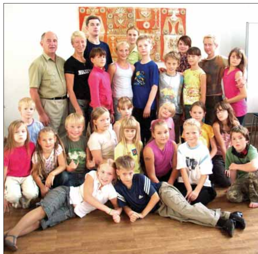
Tantsuklubi Mambo tantsijad suvises tantsulaagris Vana-Võidus