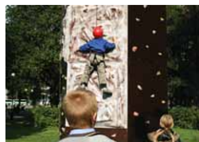
Tammsaare pargis oli üles seatud ronimissein.