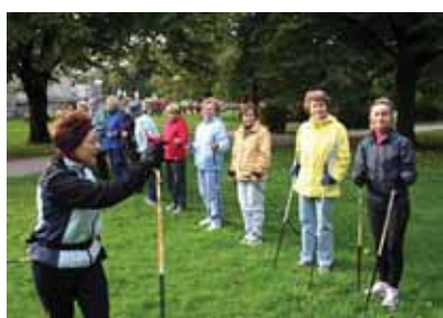
Tervisepäev Tornide väljakul algas virgutava võimlemisega.

Tervisliku seisundi kontrollimiseks ja haiguste ennetamiseks, toimus sotsiaalkeskuses koostöös Wellness-keskusega