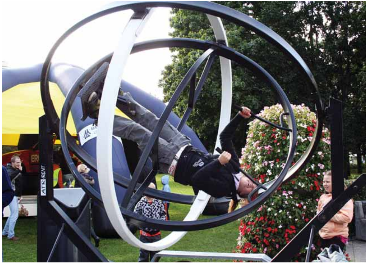
Tervisepäeval sai oma meisterlikkust proovile panna ka kosmonautide trenžööril.

Elektriraudtee sõidukaartide hinnad tõusevad 15. oktoobrist 10–50 krooni. Kõige tavalisem A-tsooni (piirkond Laagri-Tallinn-Lagedi) ühiskaart maksab praegu 510 krooni ning tulevikus 520 krooni. Sama tsooni sooduskaart aga maksab praegu 350 krooni ning 15. oktoobrist 365 krooni. Pikemaajalisi võimaldava AB-tsooni ühiskaardi hind tõuseb 640-lt kroonilt 690-le kroonile ning ABC-tsooni ühiskaart 735-lt kroonilt 785-le kroonile.