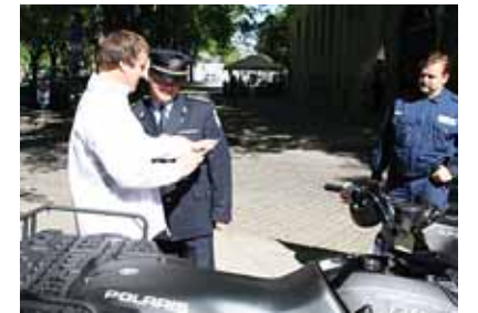
Esimene ATV kesklinna politseile.

Tihe ja mõistev koostöö Põhja Polit-seiprefektuuri Kesklinna politsei-osakonna ja Tallinna Kesklinna Valitsuse vahel sai järjekordse kin-nituse. Juunikuust on politseinike varustuses esimene ja uhiuus ATV.