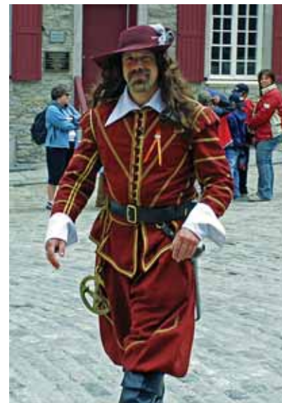
Quebeci asutaja Samvel de Champlain ilmub aegade hämarusest.

Ja teine kohtumine oli mul Quebeci all-linna Notre-Dame des Victoires kiriku esisel platsil, kus mu digikaamera ette jäi korraks Samvel de Champlain ise. Ilmudes aegade hämarusest kõndis linna rajaja turistide ja linnakodanike üllatu-