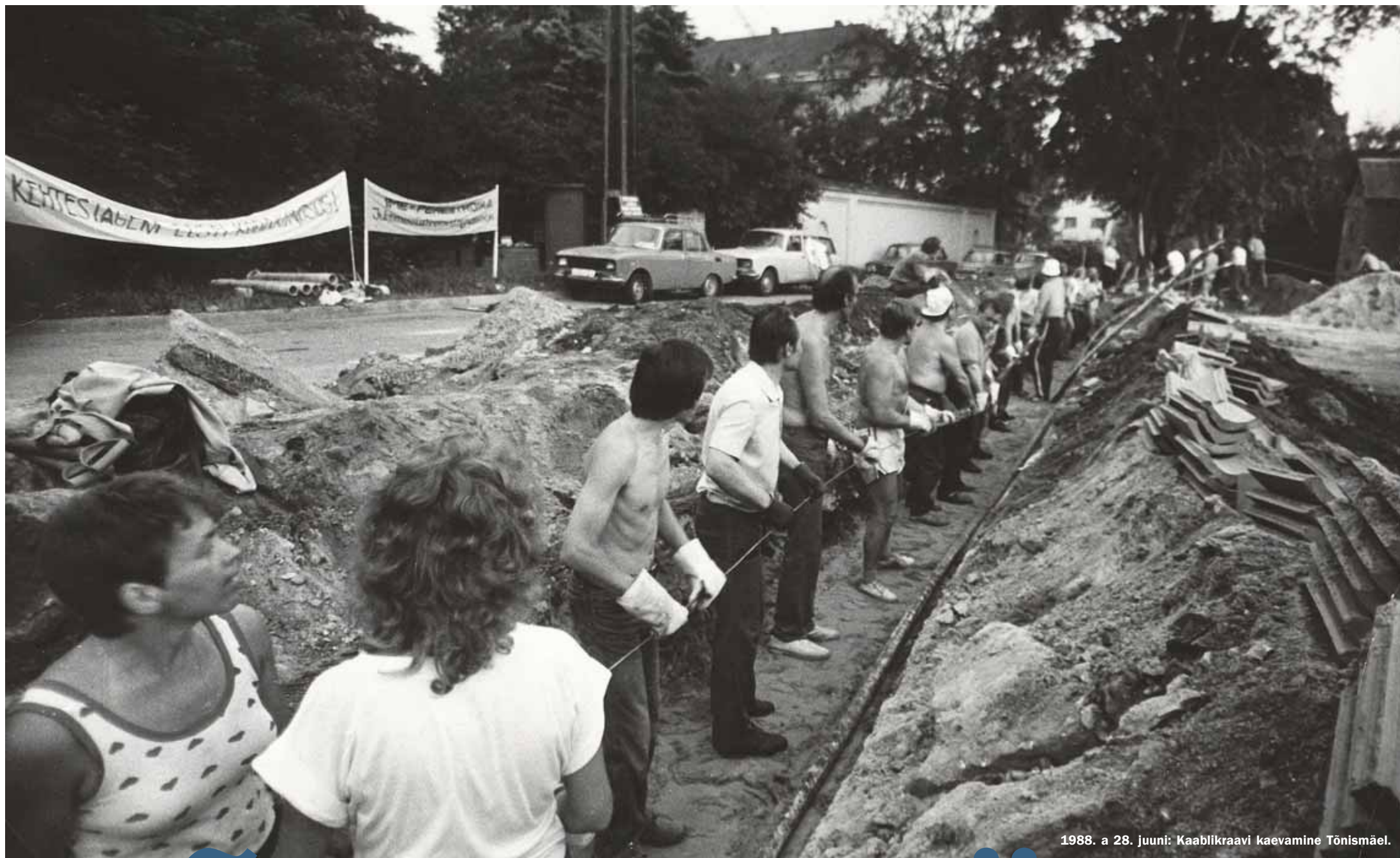
1988. a 28. juuni: Kaablikraavi kaevamine Tõnismäel.