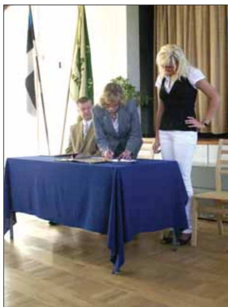
Koolirahu lepingu allkirjastamine.

ka see, kuidas õpetaja oli ennast vana-aja riietesse pannud. Sellel päeval oli väga lõbus. Pärast leiva söömist olid kõigil kohud väga täis.