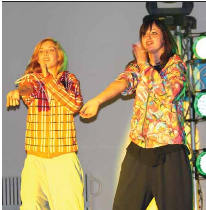
Tantsurupp E &amp; G Järveotsa gümnaasiumist

voorust: kodus ettevalmistatud kavast, improvisatsioon etüüdist, stiilivoorust ning viimases voorus tuli