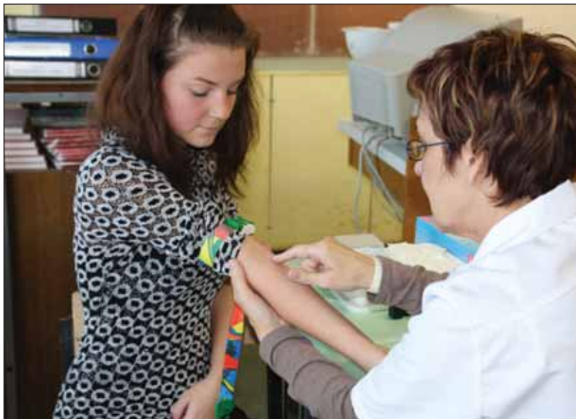
Enne vere andmist kontrolliti tulevaste doonorite tervist.