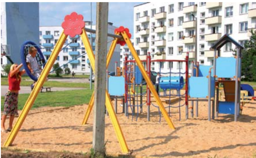
Новая игровая площадка между домами по Астангу 60 и 54.

В Хааберсти построили и отремонтировали пять детских игровых площадок, где починили старые и установили новые элементы, в основном горки, лазалки и качели.