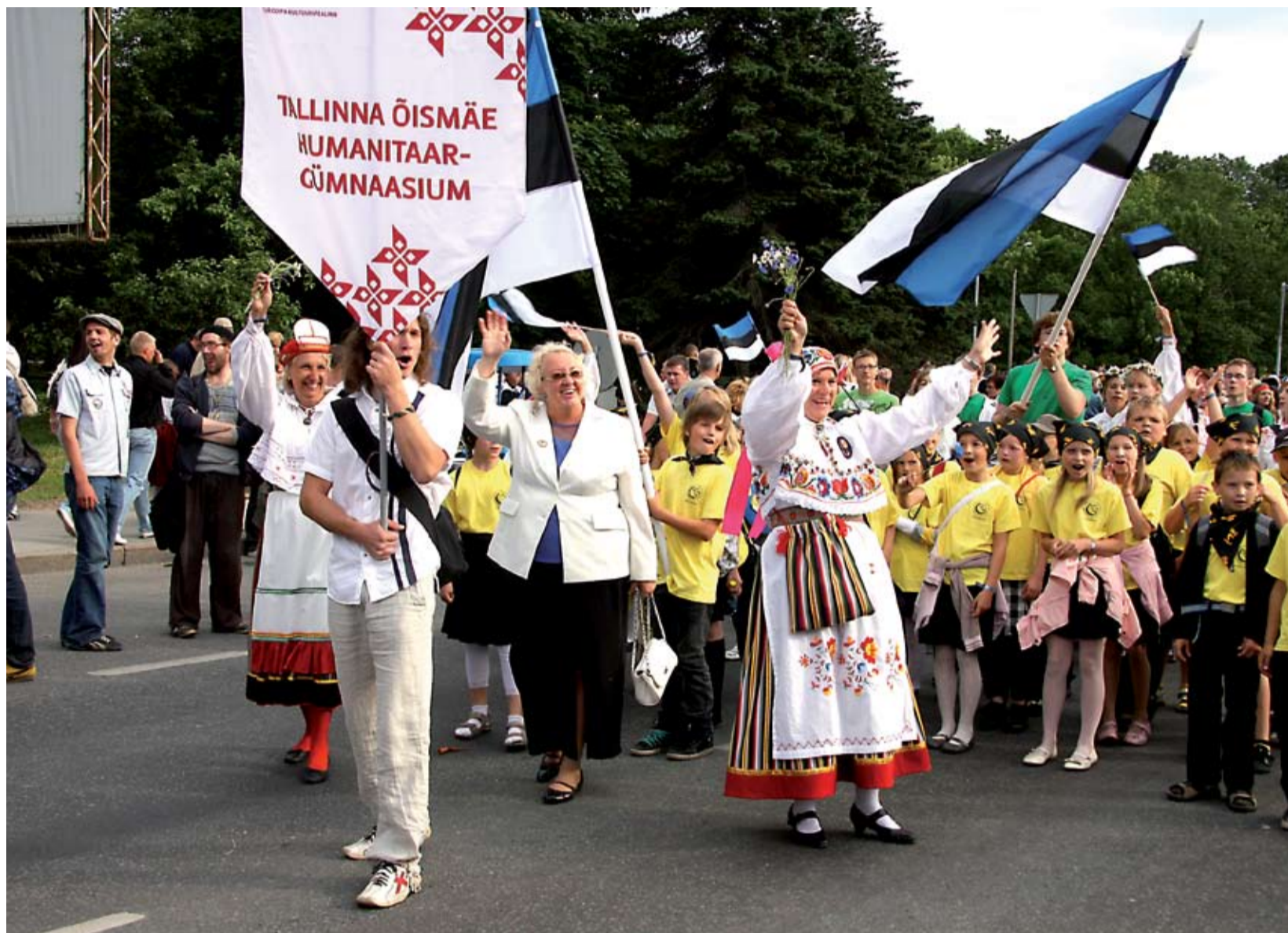
Представительство Ёйсмяэской Гуманитарной Гимназии на торжественном шествии Певческого праздника.

Эстонское общество очень малочисленное и отношения между людьми очень тесные. Не