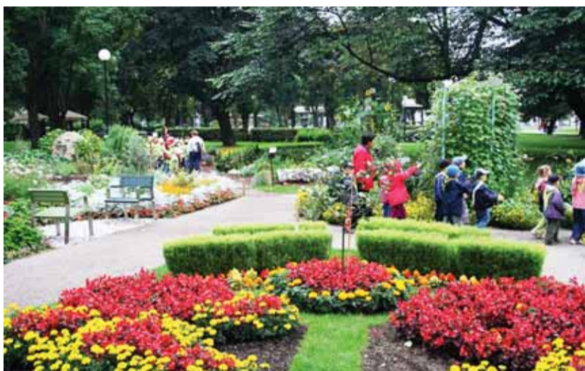
Lilleilu sügiseses pargis.

Tallinna koolinoorte triatlon on algatatud 2009. aasta augustikuus Gustav Adolphi Sihtasutuse, Eesti Triatlioni Liidu ning Tallinna Haridusameti poolt. Võistlusi toetasid mitmed erafirmad, mittetulundusühingud ja Tallinna Kesklinna Valitsus. □