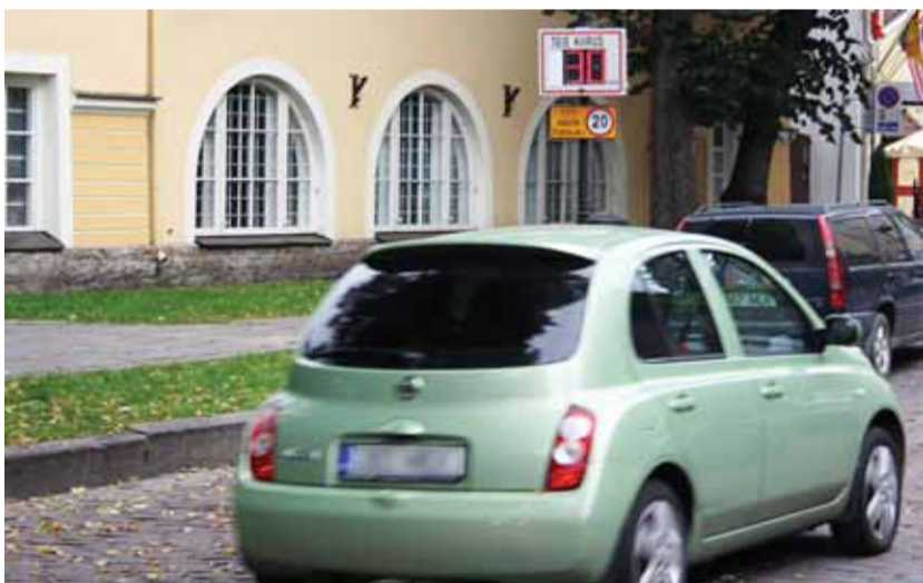
Kuhu kiirustad roheline nool?