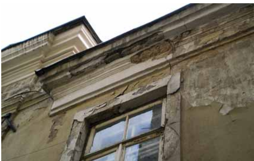
Oht sinu pea kohal.

Pilootprojektina koguti juunis andmeid Nunne tänaval liikuvate autode kiiruse ja sõidukite liikumistiheduse kohta. Analüüs näitas kurba tõsiasja, et kui mujal liiguvad asjad liikluses paremuse poole, siis vanalinna kohta pole võimalik seda väita. Kahe nädalase testperioodi vältel pidas vaid 54% autojuhtidest kinni kehtestatud kiiruspiirangust, kuus autot tuiskas vanalinna tänavail kiirusega üle 70 km/h. □