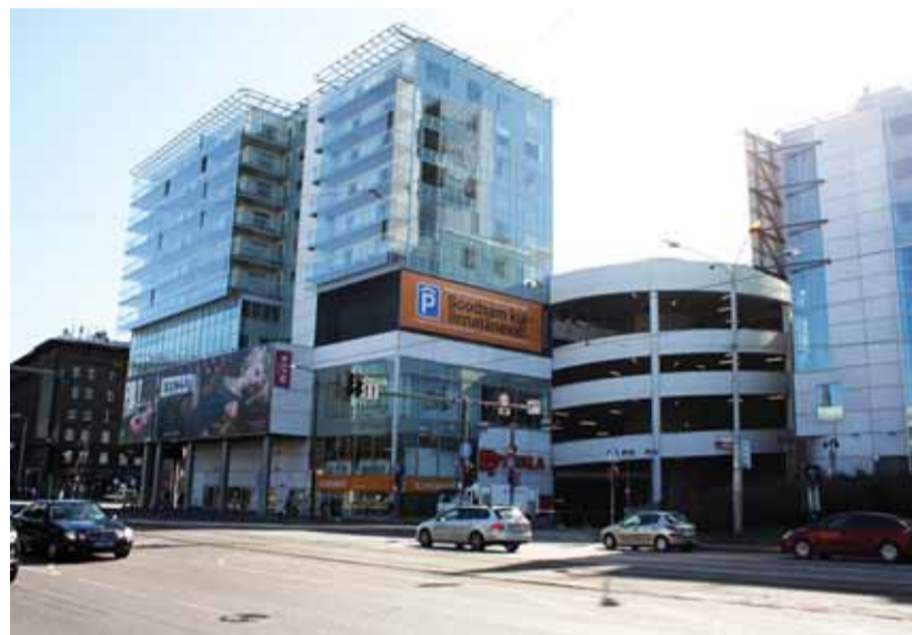
Viru Keskus. Kas isikupäratu mugavus või muganduv isikupära?

renoveeritud Vabaduse platsi minnes, kus praegu pimedana seisva Vabadus sõja võidusamba risti naabruses konutab puuvirn, süveneb mure kesklinna tuleviku pärast. Kellele see ikkagi kuulub? Turistidele? Linnavalitsusele? Või meile, kesklinna elanikele? Ei leia siit korralikku toidupoodi ega normaalsete hindadega söögikohta. Väljaspool vanalinna aga on kesklinn enamasti kõle ja pigem ikka auto- kui jalakäijasobralik. Ka heakord jätab soovida. Meil, kesklinna elanikel, peaks küll olema hoopis rohkem võimalusi, aga ka tahtmist oma linnaosa elu kujundamises kaasa rääkida. ■