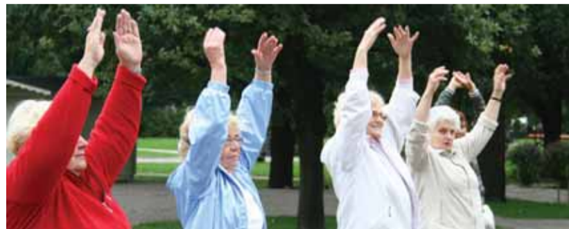
Virgutusvõimlemine enne kepikõnni starti.

10. septembril korraldas Tallinna Kesklinna Valitsus koostöös Tallinna Kesklinna Sotsiaalkeskusega sügisese tervisepäeva linnaosa eakatele.