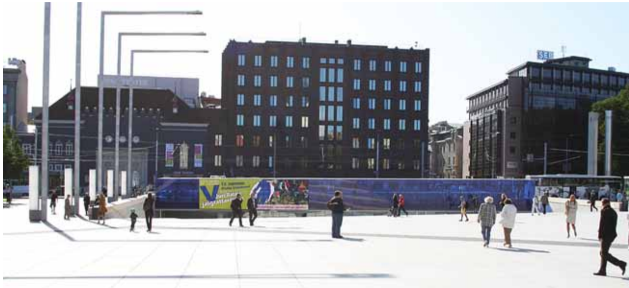
Vabaduse väljakul teostus aastakümneid püsinud unistus riigi autovabast esindusväljakust.

Tööde üle teostas järelevalvet ajaloolane Aleksander Pantelejev. Restaureerimisel arvestati muinsuskaitsele nõudeid ja häid ehitustavasid.