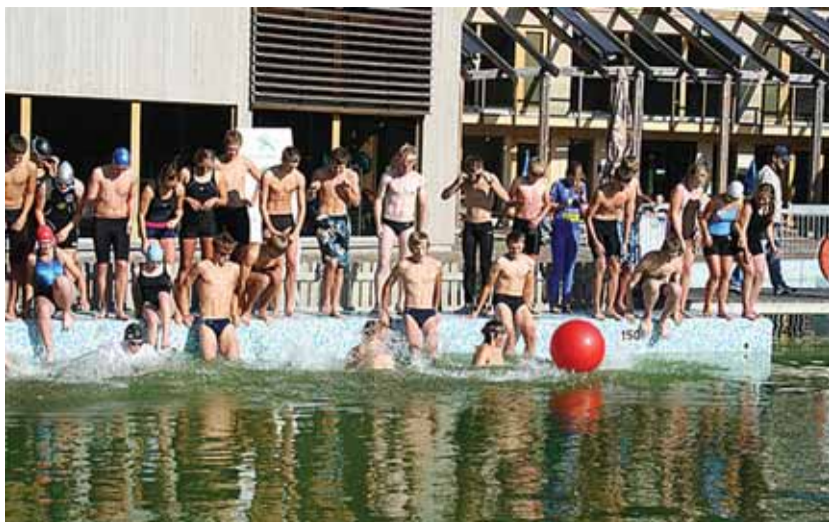
9. september raudmeeste seltskonnas.