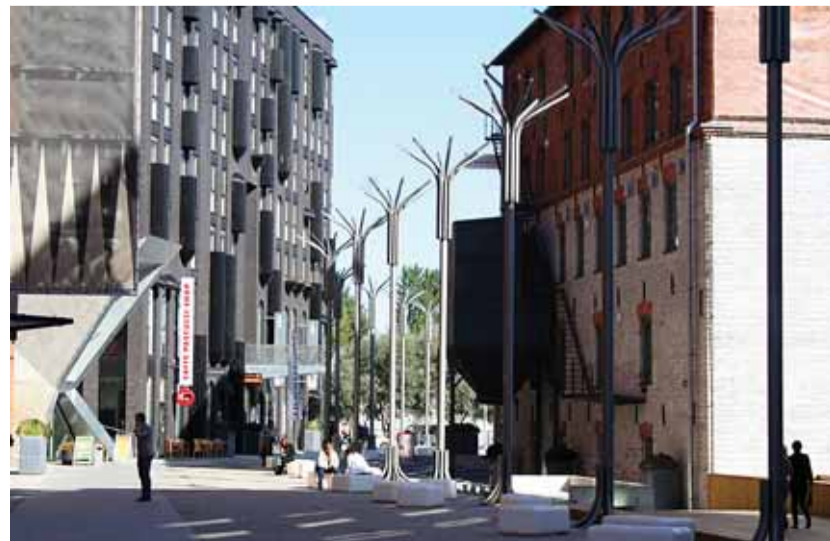
Rotermannikvartal – uus urbanistlik keskkond linnasüdames.

Selles loetelus on vaid osake nelja aastaga kordasaadetust. Tallinn on muutunud ilusamaks ja inimkeskemaks. Tallinn on kodu. ■