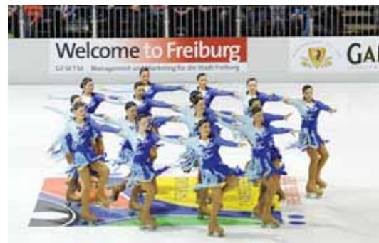
Rullesti kava võlus publikut vaatamängulisusega.

info@kesotskeskus.ee, www.kesotskeskus.ee