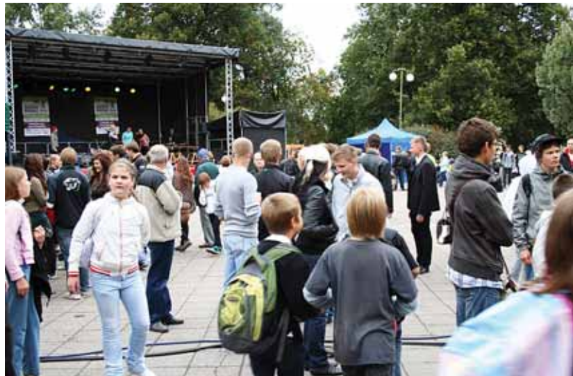
Noortekontsert Tammsaare pargis.

Sõltuvusprobleemid noorte hulgas on viimastel aastatel kiirelt kasvanud. Kui varem tavatseti rääkida, et sellesse ringi langevad enamjaolt sotsiaalselt vähemkindlustatud või keerulises sotsiaalses keskkonnas kasvavad noored, siis täna on olukord pigem vastupidine ja probleeme esineb igas sotsiaalses kihis. Noored ei ole üldjuhul erinevad. Kõik nad on vastuvõtlikud, kes on tugevam, suudab vastu panna.