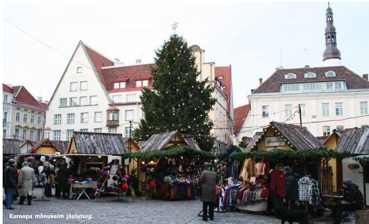
Euroopa mõnusalm jõuluturg.

29. novembril avati Raekoja platsil traditsiooniline jõuluturg. Sel aastal on turg laienenud ning lisaks linna esinduskuuse ümber paikneva 65 jõulumajakesega turukeskuse jätkub kaubandust ja ajaviidet ka Harju tänavale, Vabaduse väljakule, Tammsaare parki, Viru väravate juurde ja Rotermanni kvartalis.