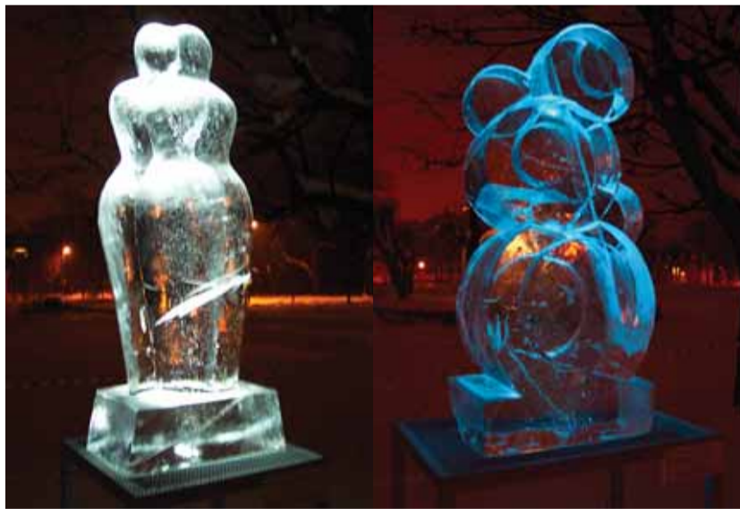
Aime Kuulbuch "Kaks poolt" ja Tiiu Kirsipuu "Variatsioon lumememme teemal".