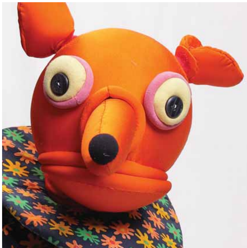
Rebane Eesti Riikliku Nukuteatri lavastusest "Nukumängulugu" (1999).