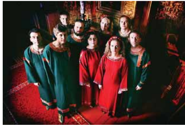
Orthodox Singers – vene kõrgekultuuri esindaja Eestis.

Kontserdi piletid saab osta Piletilevi müügipunktidest ja tund enne algust kohapeal. Lisainfo www.orthodoxsingers.com .