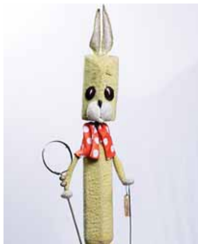
Ülemaailmse nukurahva esindaja Eesti janes.

Maailmatoas on väljas erinevat päritolu ja stiili nukud paljudest riikidest. Infot, ajaloomaterjale ja fotosid saab uurida puutetundlikelt ekraanidelt, mida on üle kolmekümne. Ekraanide ümber on paigutatud rohkem kui 100 nukku lavas-