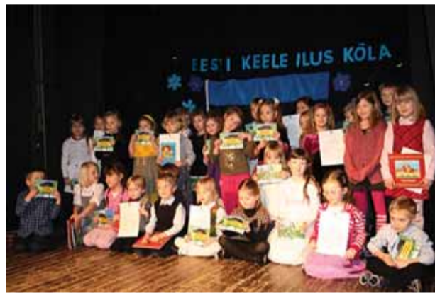
Väikesed luule- ja keelesõbrad.

korraldasid Tallinna Kesklinna Valitsus koostöös Kanutiaia ja Kopli Noortemajaga ning Mardi Lasteaiaiga.