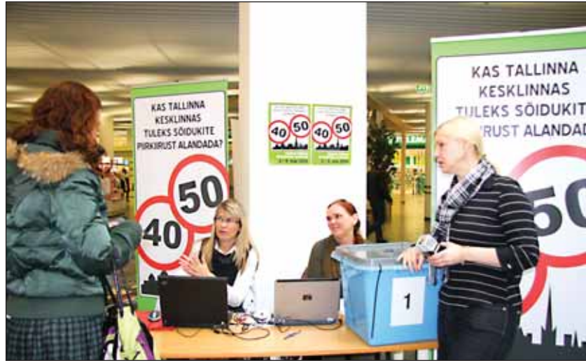
В пункте опроса торгового центра Рокка аль Маре выразили свое мнение 784 горожанина.

Мероприятие поддерживают GP patarei, Министерство окружающей среды, Таллиннский департамент окружающей среды, Фонд природы Эстонии, магазин Лоодуспере. СМИ партнер "Постимез". Изучи все подробнее по адресу www.kus.ee