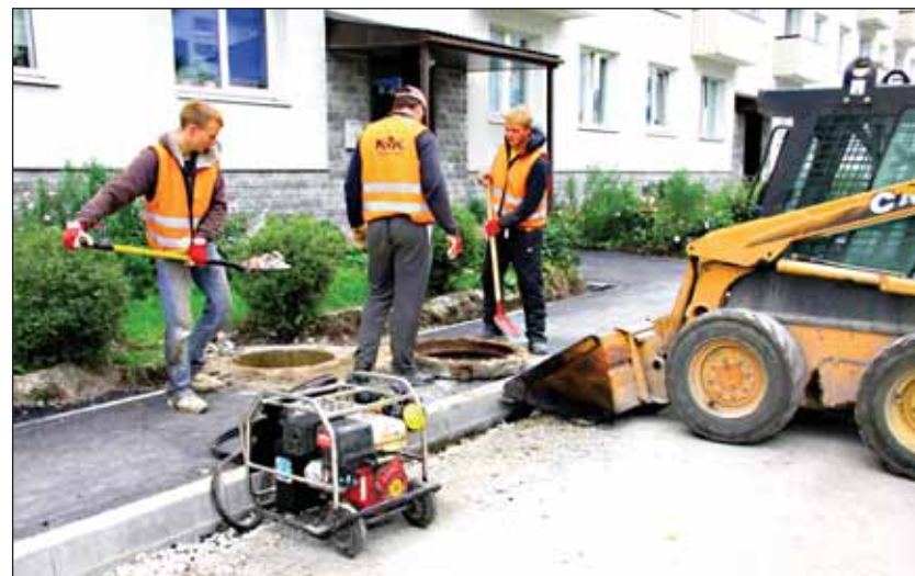
Tööd Astangu 68 elamu ees.

Selle suve jooksul olen Astangul käinud mitu korda ja kohtunud asumi korteriühistute esindajatega. Mul on hea meel tõdeda, et elanikud ja KÜ-de esindajad ei jäänud passiivseteks pealtvaatajateks, vaid tegid omapoolseid ettepanekuid ning juhtisid tähelepanu probleemsetele kohtadele. Tänu koostööle tehti projektis mitu muudatust. Nii näiteks laiendasime sõiduteed majade nr 36 ja 42 ees, leidsime lisaraha maja nr 26 esise remondiks. Pean tunnustama, et esialgse projekti kohaselt ei olnud kahjuks Astangu 26 majaesine arvestatud töömahtude hulka. Korteriühistute esinaine suutis meid aga ümber veenda. Hilisemal vaatlusel ja kaalutlustel selgus, et ka majaesine vajab siiski viivitamatult remonti. Meil õnnestus leida eelarvelistest vahenditest lisaks 200 000 krooni, mille lülitasime Astangu 26 majaesine käimasolevasse remonddiplaani.