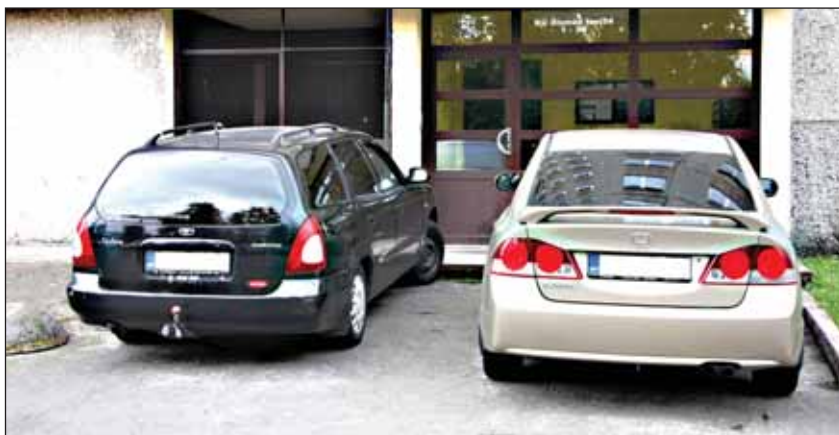
Tüüpiline parkimine Õismäel. Hea, et trepikojal ukse ees on, muidu oleks need autod enamast trepikotta parkinud.

Kõnniteel parkimine on seaduse-rikkumine, mille eest hoiatatakse ning karistatakse. Vahepeal on munitsipaalpolitsei jätnud selle tähelepanuta, viimasel ajal aga võttis tõsiselt käsi. Ma saan väga hästi aru, et paljudes kohtades on parkimine osaliselt sõiduteele ratsionaalseks lahenduseks nii jalakäijatele kui autojuhtidele, ise olen Õismäe vahel asju ajades oma auto teie omadega samamoodi parkinud, riskides samasuguse trahviga. Ainult et trahvimine olukorda ei paranda. Joonida parkimiskohad osaliselt kõnniteele – sellise lahendusega ei ole aga transpordiamet nõus. Seda ei taha hästi ka linnaosa valitsus – parkivad autod takistavad õuealade koristustöid. Nagu ilmekalt näitas