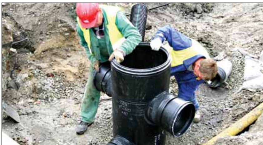
Прокладка канализационной трассы в 2008 году на улице Пийбелехе.