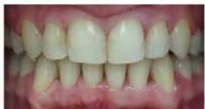
...и после лечения.