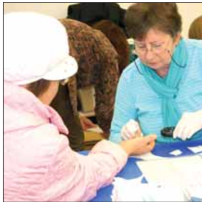
Эстонский союз ревматиков измеряет в крови количество сахара и холестерина.

Хорошей традицией стала в День здоровья возможность посетить ярмарку и семинар здоровья, оздоровительную гимнастику ТАЙ-ШИ, и конечно, сеансы музыкальной терапии в бассейне. На ярмарке здоровья представили различную продукцию и делали замеры показателей здоровья