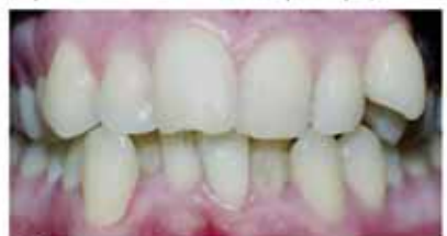
Зубы взрослого пациента до...

Если вы уже долгое время хотели поменять что-то, связанное с прикусом или положением зубов, но из-за своего возраста считали это невозможным, то всё же было бы правильно обратиться за консультацией к ортодонт и узнать о возможностях лечения.