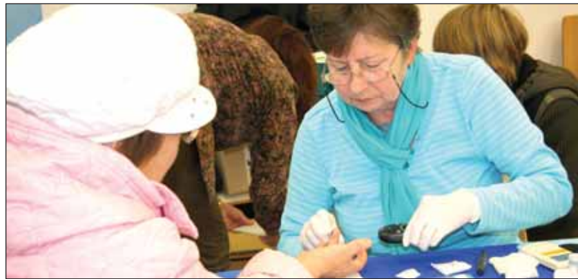
Eesti Reumaliit veresuhkrut ja kolesterooli mõõtmata.