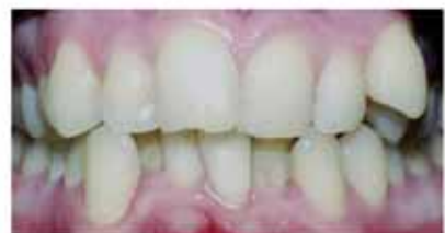
Täiskasvanud patsiendi hambad enne...

Erinevalt lastest on täiskasvanud patsientidel lõualuude kasv lõppenud, seetõttu kasvu modifitseerimist nõudvaid ravimeetodeid täiskasvanutel kasutada ei saa. Lõualuude suhtenomaaliat korraldab kombineeritakse ortodontilist ravi