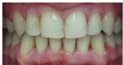
...ja pärast ravi.

Kui Te olete juba pikemat aega soovitud midagi oma hammaste juures muuta, aga pidanud seda vanuse tõttu võimatuks, oleks siiski õigem pöörduda ortodonti konsultatsioonile, et saada teavet erinevate ravivõimaluste kohta.