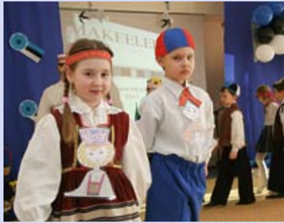
Emakeelepäeva kontsert Mesipuu Lasteaias LK 2