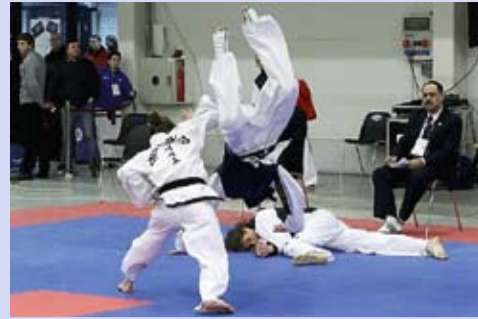
Ülemaailmsed Võitluskunsti Mängud LK 5