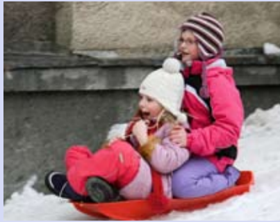
Vastlatrall Põhja-Tallinna moodi LK 4