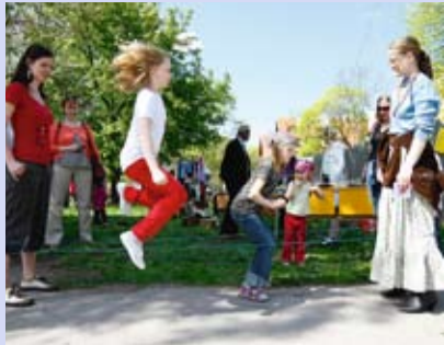
Kalamajal olid päevad LK 2