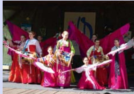
Rahvusvahelise Rahvuskultuuride Ühenduste Liidu LÜÜRA 19. sünnipäev! LK 5