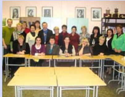
Tallinna Ranniku Gümnaasium LK 4