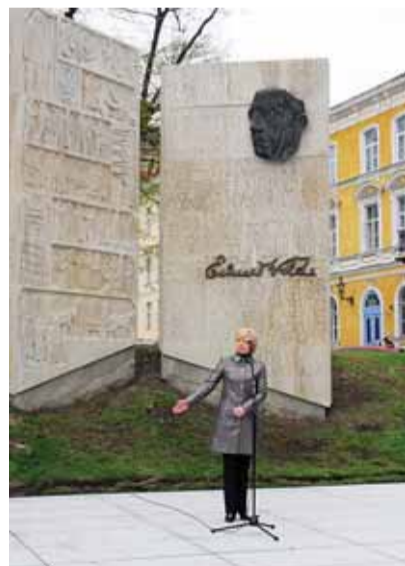
Tallinna Kesklinna vanem kõnelemas monumendi avamisel.

Monumenti ümbritseva platsi korramisega jõutakse lõpule augustis. Selleks ajaks tuleb välja vahetada kogu plaadistus ja trepistik, taastada platsi ümbritsevad tugimüürid, rekonstrueerida Harju tänavaga paralleelne madal müür pingiga ning korramada massiivsed lillevaasid.