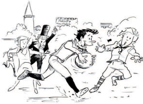
"Webb Ellis, lõpeta ometi - reeglite järgi nii ei tohi!"