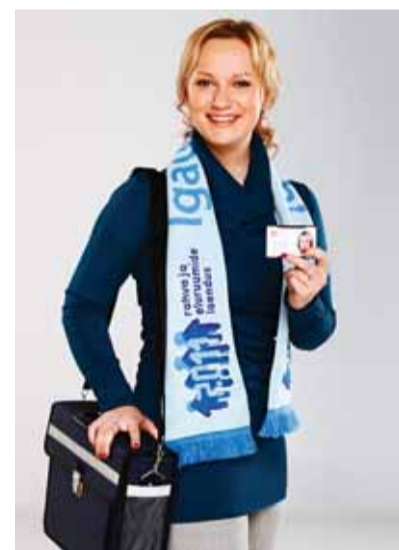
Rahvaloendaja tunneb ära pildiga töötõendi, sinise kohvri ja loenduse logoga salli järgi.