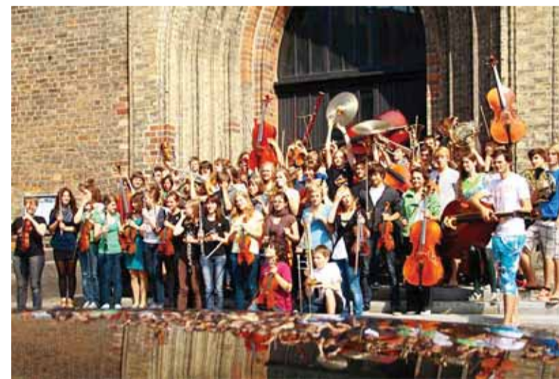
Mecklenburg-Vorpommerni nooruslik orkester.

Mecklenburg-Vorpommerni Liidumaa Noorteorkestri kui kogu maailma SOS-lastekülade saadik kontsertreisil Eestis.