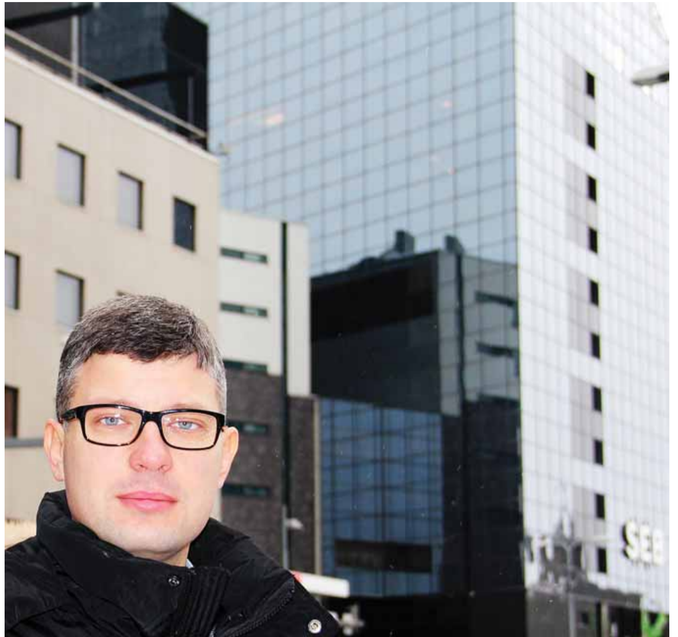
Kesklinn pürib kõrgustesse.

Kuidas nii? See kiri pani protsessid liikuma – näitas lahendusvõimaluse, millest seni polnud piisavalt räägitud ning, mis kõige olulisem, muutis ka lohakil kinnistute omanikud koostööalimaks. Koos eelpoolmainitud kirjaga saatsime meeldetuletused lagunevate majade omanikele, sooviga saada konkreetne vastus, millal