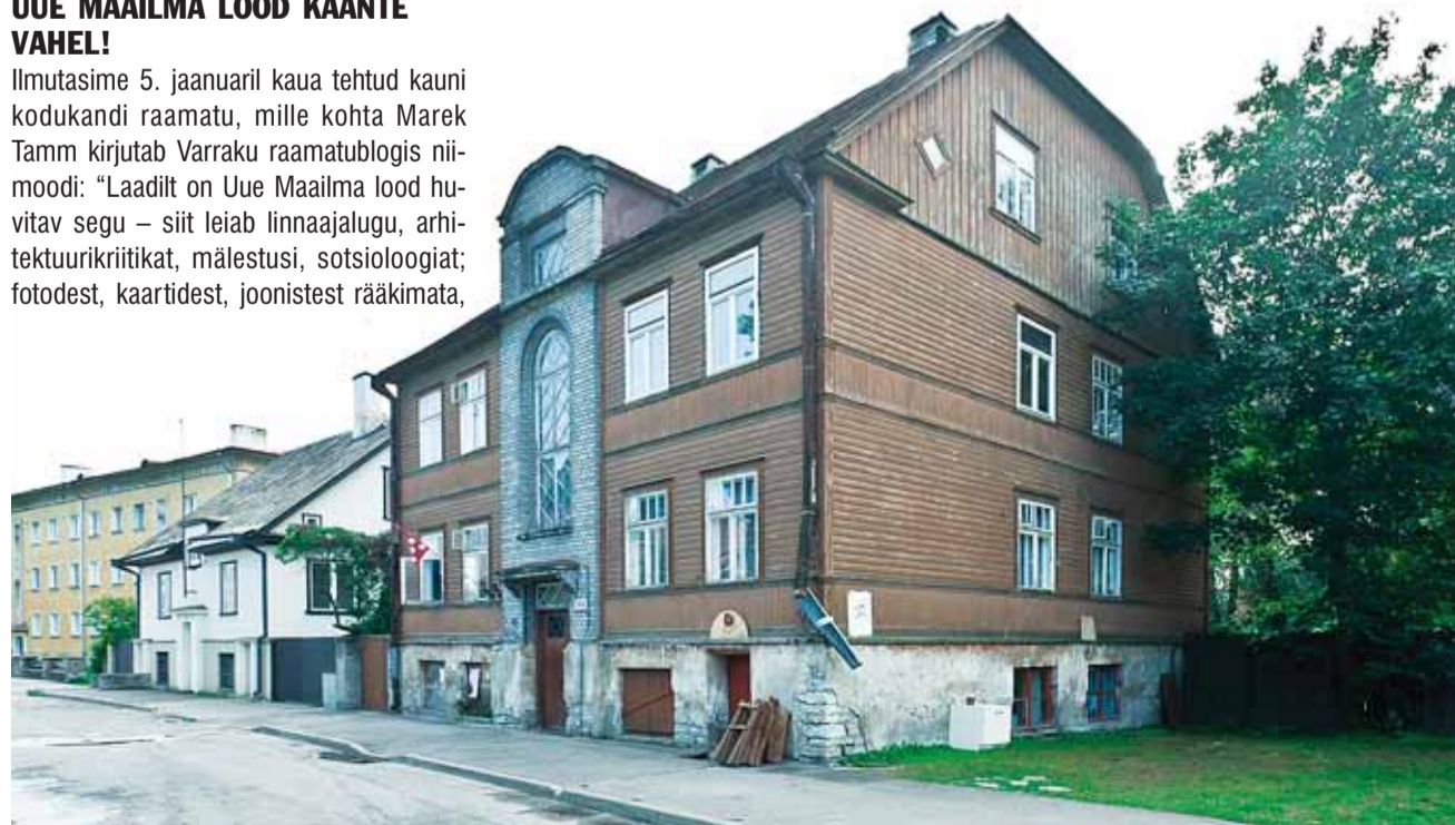
Selles majas asub lemmikraamatute kogu Kapsad.

Üle-Eestilise Noorte Sümfooniaorkestri (ÜENSO) kontserdil esinev kammerkoosseis baseerub enamasti Nõmme Muusikakooli vilistlastel, kes pikka aega mänginud nii muusikakooli sümfooniaorkestris kui ka ÜENSO-s ja saanud tugeva orkestripraktika ning esinenud kaalukatel kontsertreisidel ja festivalidel Saksamaal, Prantsusmaal, Itaalias, Hollandis, Lõuna-Aafrika Vabariigis jm.