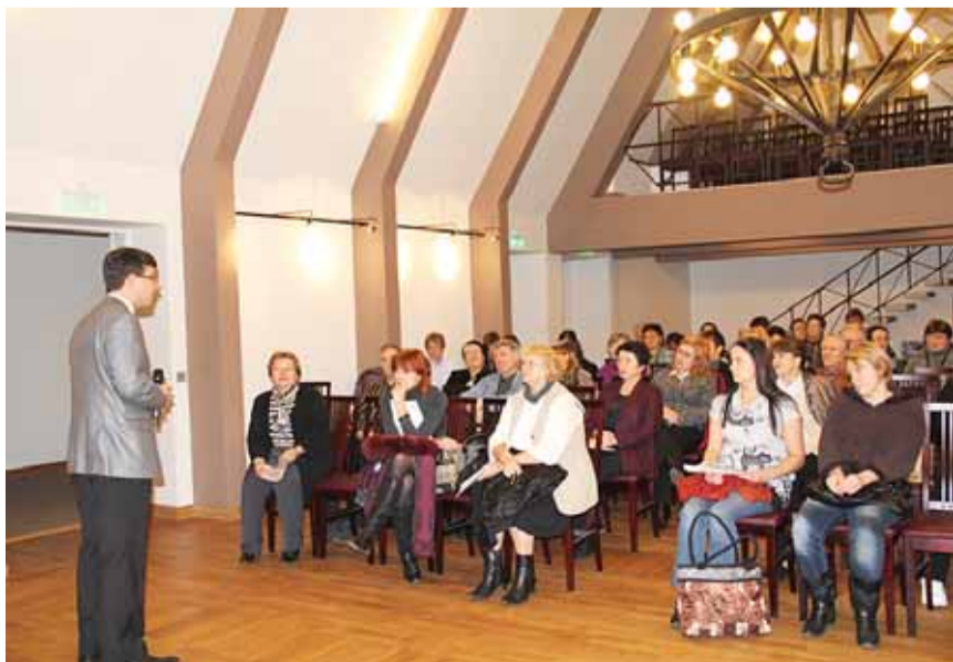
Kohtumisel korterühistute esindajatega.

Talv on alati ekstreemne, alaku see siis oktoobri lõpus rekordiliste lumesadudega nagu mõned aastad tagasi või alles jaanuari esimesel dekaadil nagu nüüd. Erakordseteks ilmaoludeks tuleb valmis olla ning