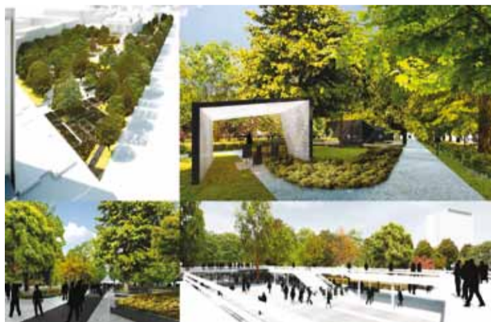
Caption: Architects from the architecture agency Kadarik Tüür Arhitektid OÜ: the aim of the winning project was to integrate all the separate parts of Tammsaare Park in a well-functioning, holistic prominent park.

Judging panel for the Tammsaare Park city space solution conceptual design contest decided that the best work out of the 22 submitted contesting projects was the one called Belle Epoque.