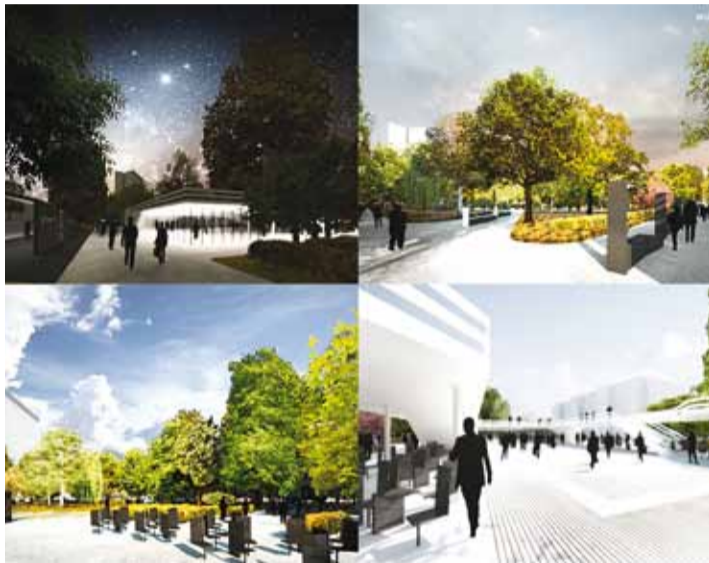
Целью победившей на конкурсе работы архитектурного бюро Kadarik Tüüri Arhitektid OÜ было соединить различные части парка Таммсааре в целостный представительный парк.

Жюри конкурса идей по решению городского пространства парка Таммсааре признало лучшей из 22 поступивших работ на конкурс работу «Belle Epoque».