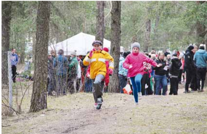
Järve terviserajal toimus 16. aprillil Kesklinna orienteerumispäev, mille eesmärk oli tervislike eluviiside edendamine ja orienteerumise populariseerimine südamenädala raames.

Kesklinna südamenädal toimus 16. aprillist kuni 21. aprillini üle-eestilise südamenädala raames, mille eesmärk oli julgustada inimesi liikuma ja pöörata tähelepanu tervislikele eluviisidele.