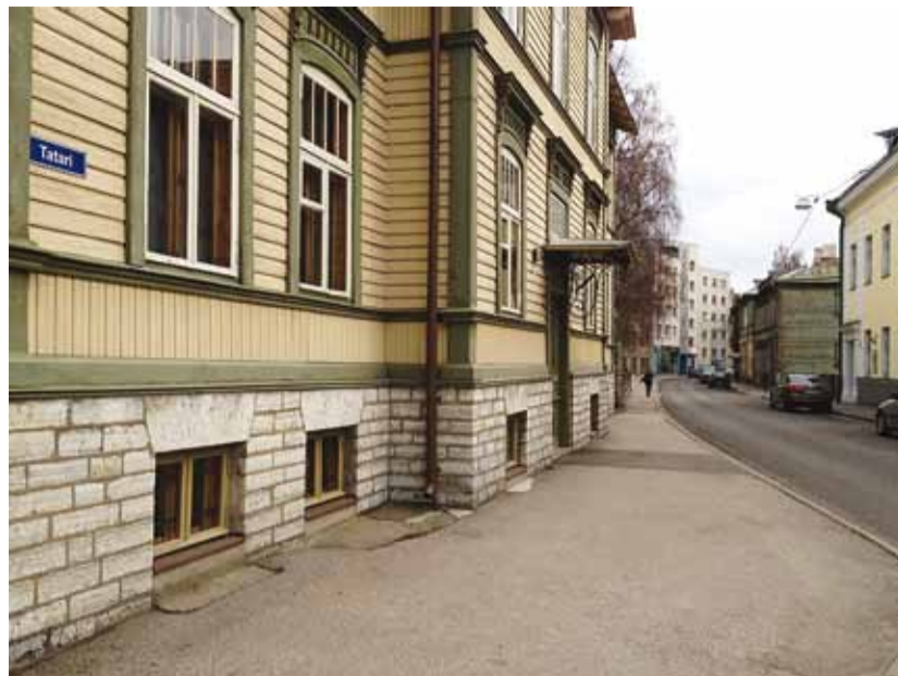
Tatari asumi muudab eriti väärtuslikuks selle peaaegu terviklikult säilinud arhitektuurne ilme.