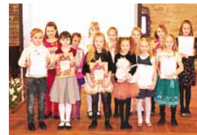
Laulukarusselli Kesklinna eelvooru võitjad.

Hopneri majas viidi 5. aprillil läbi Laulukarussell 2012 Kesklinna eelvoor.