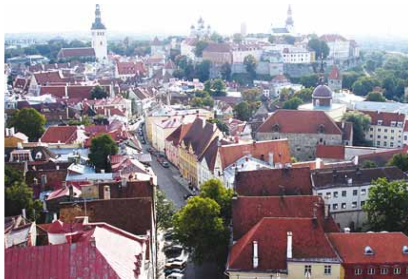
Kodu on kaunim, kui ta on turvaline.

Tallinna Kesklinna Valitsus on alustanud projektiga "Turvaline kodu". Varasemalt on väga edukad olnud sarnased projektid nagu "Roheline õu" ja "Hoovid korda", seega leidsime, et seekord aitame Kesklinna linnaosa korteriühistutel, korteriühistustel ja majaomanikel hoove turvalisemaks muuta.