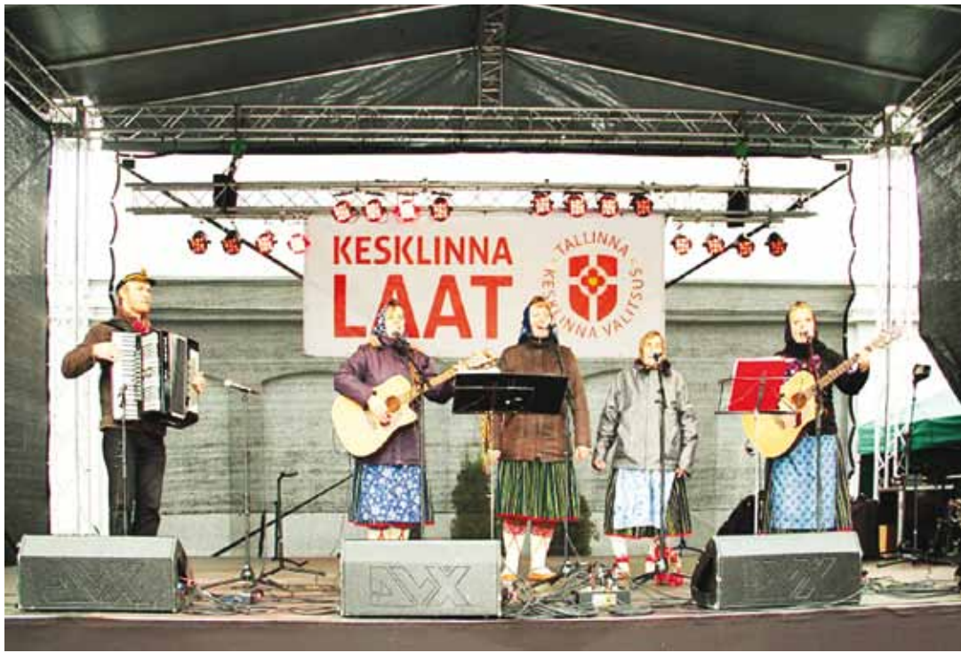
Кихну Вирве с сопровождающими ее жителями Кихну пела, чтобы день был еще более радостным.

В субботу 13 октября парковка стадиона «Калев» была заполнена посетителями: здесь проходила первая Осенняя ярмарка в районе Кесклинн. Организаторами мероприятия стали управа таллиннского района Кесклинн и футбольный клуб «Tallinna Kalev».