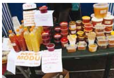
Mida kõike meest saab!