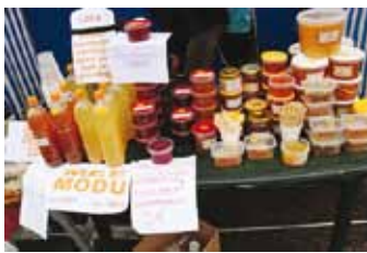
What all can be produced from honey!