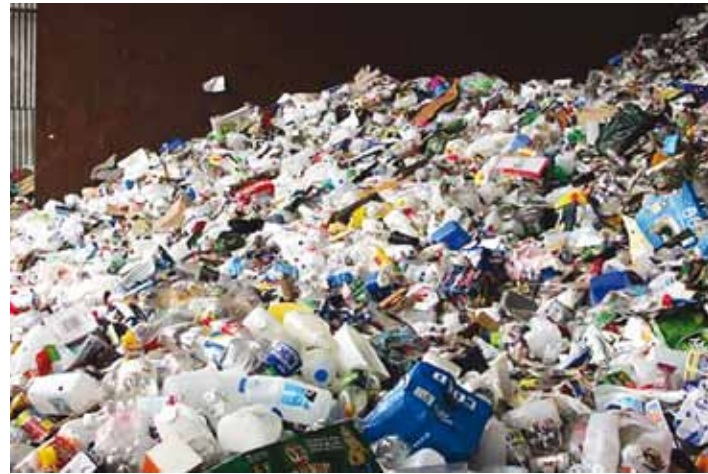
Prüghunnikute vähendamiseks saab Tallinn 50 uut pakendipunkti.

1. novembril kell 14 avab Eesti Taaskasutusorganisatsioon (ETO) Pärnu maantee viadukti läheduses projekti "Pakendipunktide konteinerkogumise laiendamiseks Tallin-