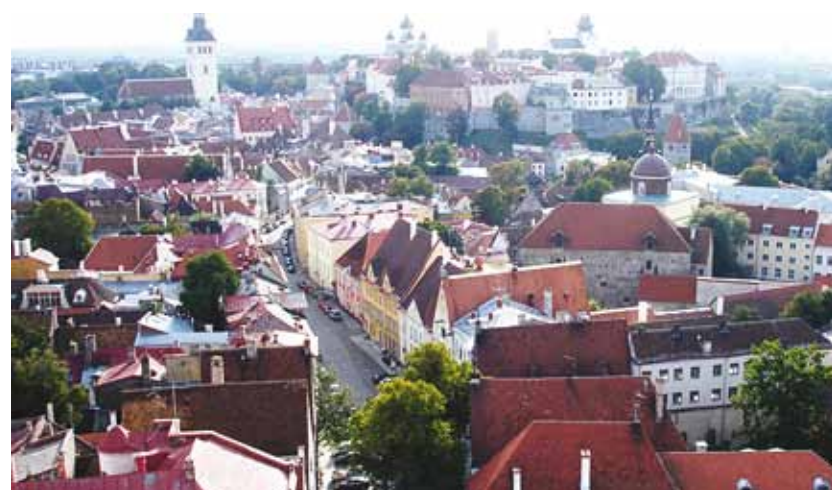
Home is more beautiful if it is safe.

The Tallinn City Centre Government has launched a project "SAFE HOME". Since previous similar projects "GREEN GARDEN" and "LET'S SET OUR GARDENS IN ORDER" have been extremely successful, we decided that this time we will help the City Centre district apartment associations and house owners to make their gardens safer.