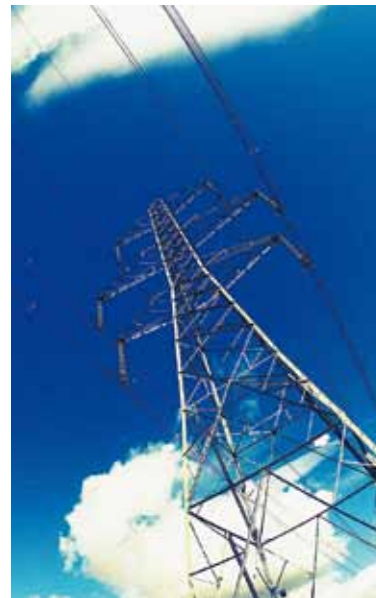
Turu avanemisest mõjutatud elektrenergia hind moodustab igakuisest elektriarvest vaid kolmandiku.

Elektri olemasolu on tagatud ka siis, kui müüjat ei valita. Sellist ilma lepinguta elektritarbimist nimetatakse üldteenuse kasutamiseks ja seda üldteenust osutab võrguettevõtja. Üld-