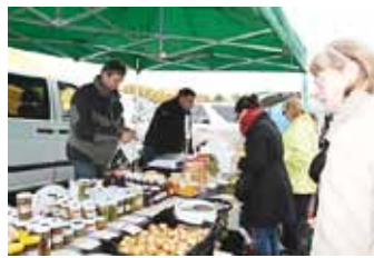
Popular home-made vegetable salads.

ertain themselves on a trampoline and a SKYJUMP attraction; it was also possible to test one's skills at football. Public order was guaranteed by Tallinn's municipal police. Participation in the fair was free of charge both for the buyers and the sellers.