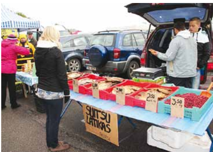
Прибывший из Причудья копченый лещ – настоящее объеденье!

Кроме того, на ярмарке можно было подкрепиться обычными ярмарочными блюдами (шашлыком и колбасками), а также супом, булочками и другими угощениями. Особенно было приятно в прохладный осенний день попробовать свежий