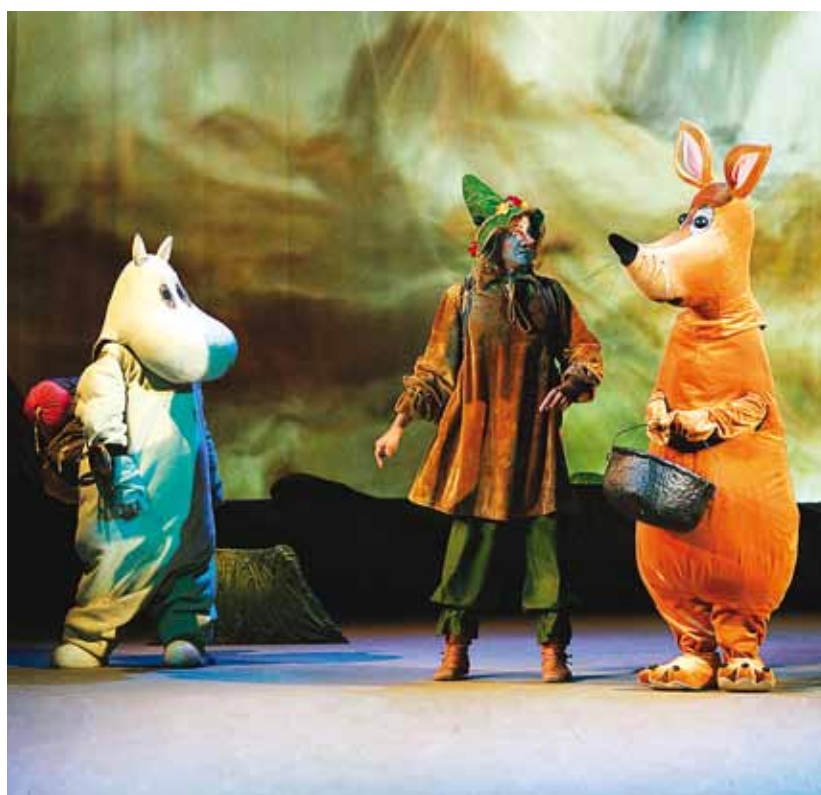
Stseen lavastusest "Muumitroll ja Sabatäht".

Ulmeklassikasse kuuluv "Lilled Algernonile" etendub Vene Teatri väikeses saalis esmaspäeval, 26. novembril. Tehasetöölise Charlie Gordonile tehakse ülikeerukas operatsioon, mis peaks suurendama tema intelligentsust kolmekordseks. Kuid inimese teadvuse ja aju muutmise eest makstav hind selgub alles pärast operatsiooni.