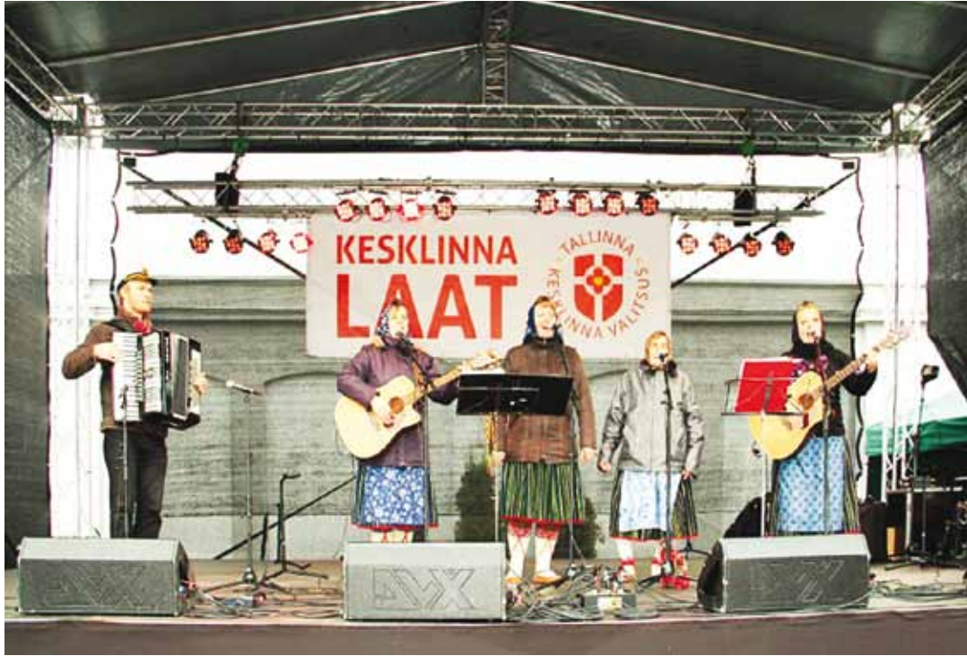
Kihnu Virve together with the accompanying people from the Island Kihnu sang the day cheerful.

On Saturday, October 13, the parking lot of Kalevi Stadium was filled with people – the first City Centre Autumn Fair was taking place. The event was organised by the Tallinn City Centre Government and the football club Tallinna Kalev.