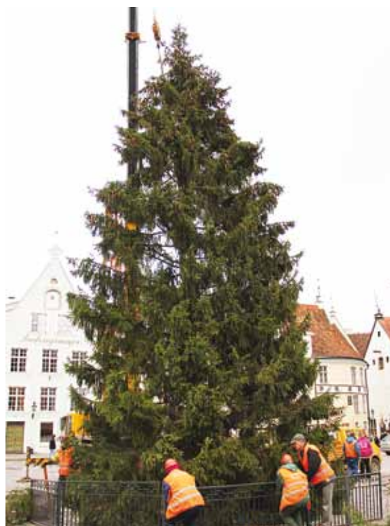
The tree was erected on the 15th of November.

The Christmas market was opened on the 24th of November and there are altogether 100 sellers. The candles on the tree will be lit on the 1st advent, i.e. on the 2nd of December 2012.