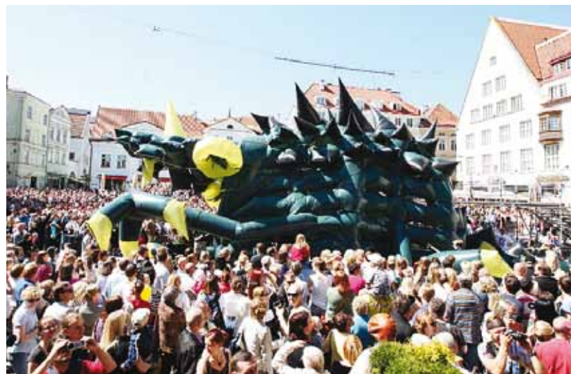
The opening performance of the Old Town Days on Town Hall Square in 2012 (director: Sasha Pepeljajev).