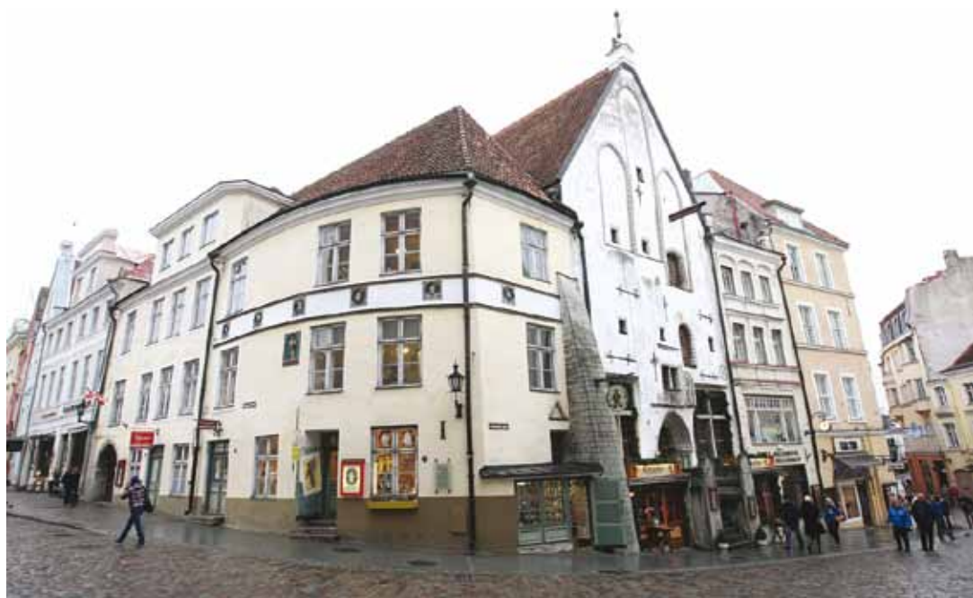
Hopner House by the side of the Town Hall Square.

The Tallinn Matkamaja, Hinko de Like fabric store, Hove House, Heydemann House, the merchant Albrecht Viende's House, the bakery, the sports lottery sales facility... This by far non-exhaustive list is at the moment and in the present day connected by one common name – Hopner House.