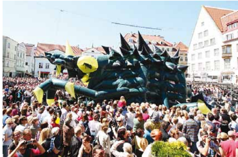
Представление на Ратушной площади, посвященное открытию Дней Старого города в 2012 году. (Режиссер Саша Пепеляев).