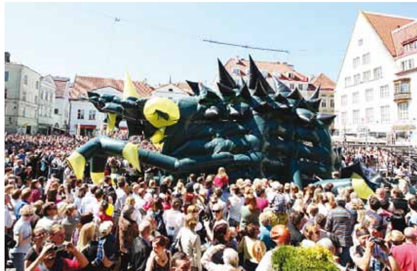
Vanalinna päevade avalavastus Raekoja platsil 2012 aastal. (Lavastaja Sasha Pepeljajev)

Lisainfo www.vanalinnapaevad.ee , info@vanalinnapaevad.ee