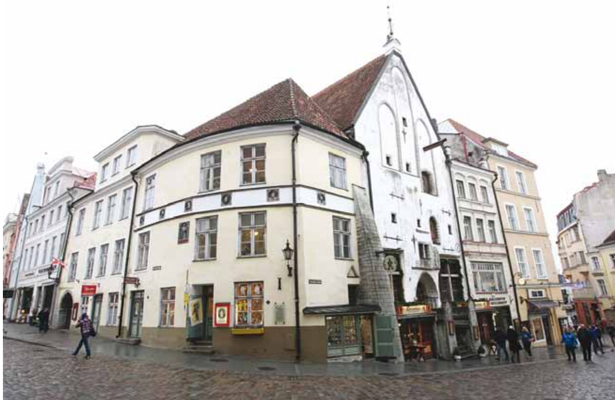
Hopneri maja Raekoja platsi serval.