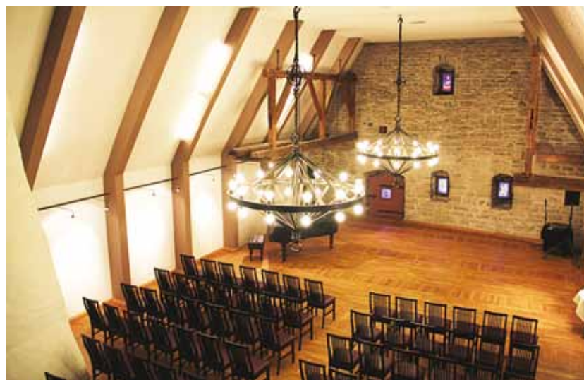
Vaade Hopneri maja saalile.

Põnevate avastamisväärsust on palju terves majas. Väga eriline ja ajastuhõnguline on maja Vanaturu kaela poolne diele ja dörnse osa, kus restoranis Estländer tegutseb praegu Olde Hansa majarahvas, pakkudes mekkimiseks mõnusaad eestimaiseid maitseid.