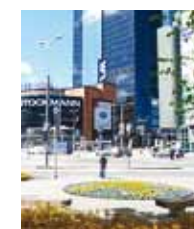
The sculpture is planned to be erected onto the green area at the Tartu Highway and Liivalaia Street crossing.

On Friday, the 23rd of November, a competent panel of judges gathered in the conference hall of the Tallinn City Centre Government, to choose the winner as well as the second and third place holders of the sculpture design contest Notice the Addiction from among 44 dignified candidates.