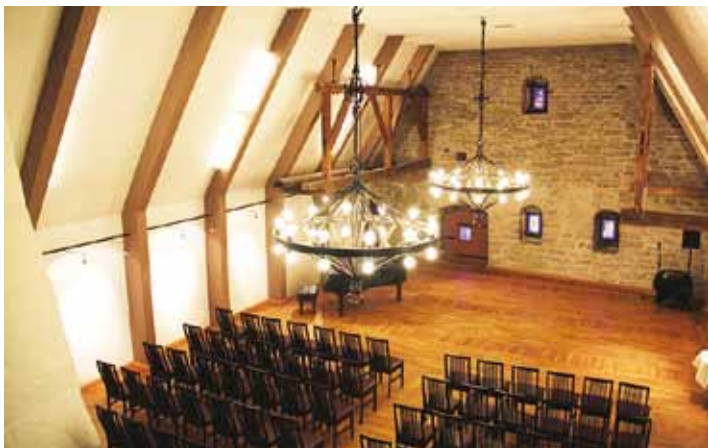
A view to the Hopner House Hall.

There are plenty of exciting things worth discovering in the house. The so-called diele-dornse part of the building on the Vanaturu kael side is very special and era-specific, and it is also the place where the Olde Hansa house folk serve enjoyable Estonian cuisines for everyone to taste in restaurant Estländer.