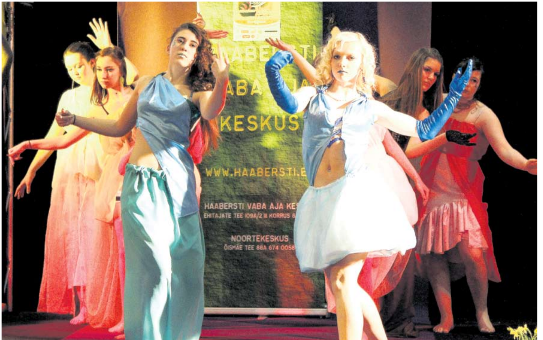
Коллекция учащихся гимназии Ярвеотса «Делириум», коллекция учащихся Мустыйеской гимназии «Ом намах шивайа» («От намах шивау»).