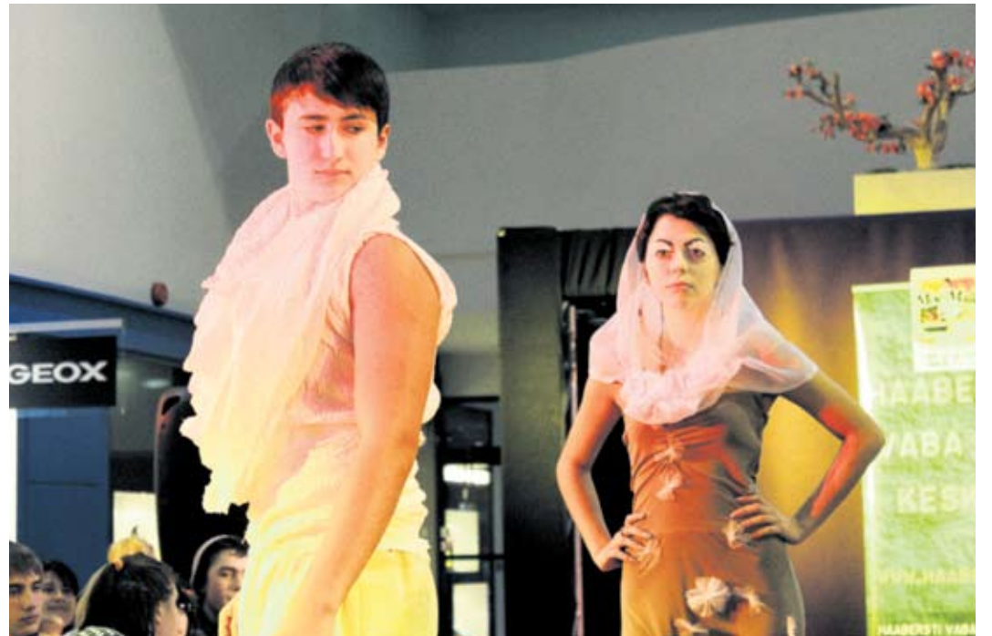
Коллекция учащихся Ыйсмяэского русского лицея «Природные катаклизмы».