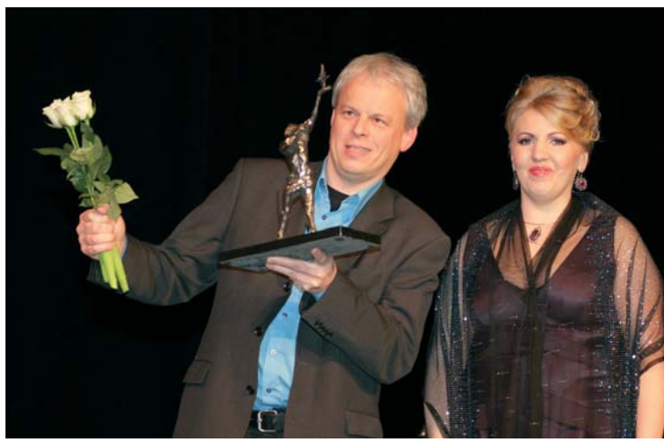
Meenutusl vabariigi aastapäevalt lk 2