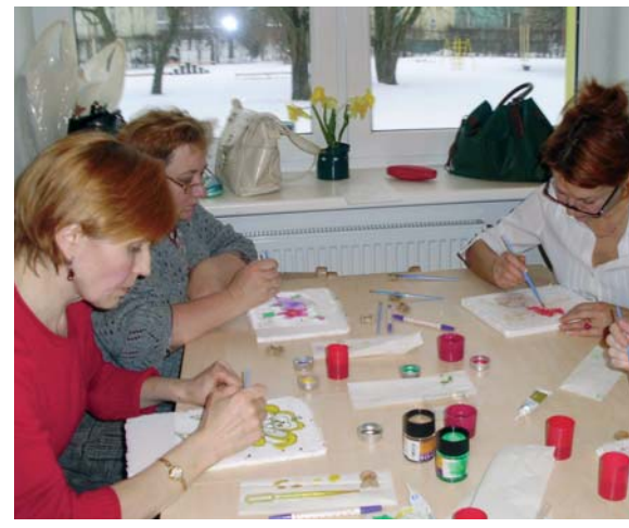
Sildimaallmise meistrituba lastealas Pelguranna lk 5