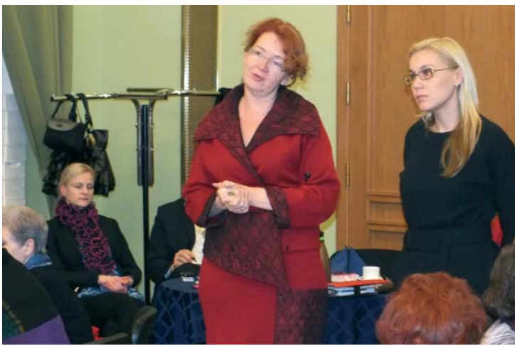
Keskerakonna Riigikogu liikmed külas Põhja-Tallinnas lk 3