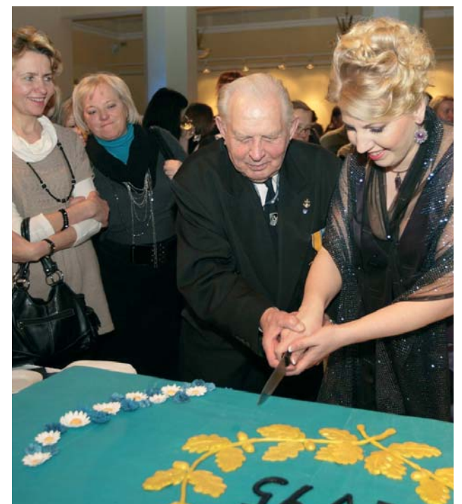
Pidulik ja rõõmus tordi lahtilõikamine