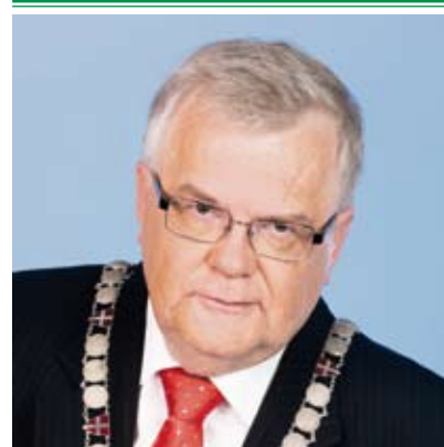
Эдгар Сависаар Мэр Таллинна

Завершается 2013 год. Что можно о нем сказать, подводя итоги?