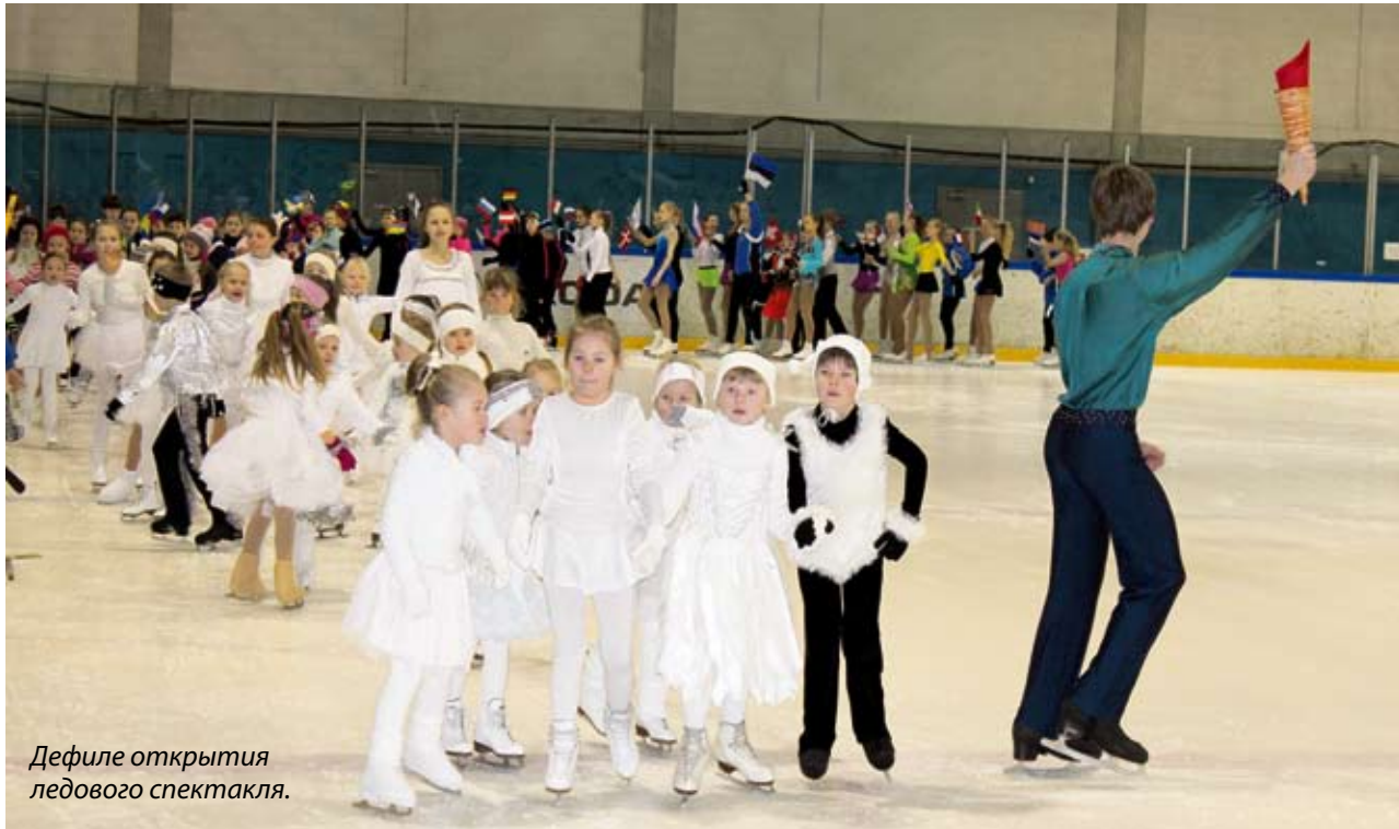
Дефиле открытия ледового спектакля.

Учащиеся школ Хааберсти и дети детских садов бесплатно посетили ледовое представление.