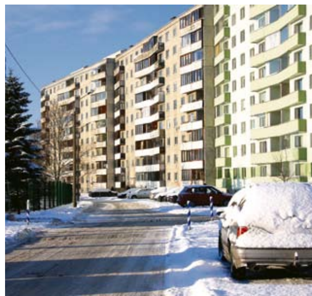
Очень важно содержать дороги чистыми.

И поскольку прошлый конкурс ораторов из русских школ на эстонском языке проходил 12.12.12 в 12 часов, нынешний 13.12.13, то можно надеяться, что следующий состоится 12.12.14 в 14 часов. Готовьтесь прийти, поучаствовать и победить! ●