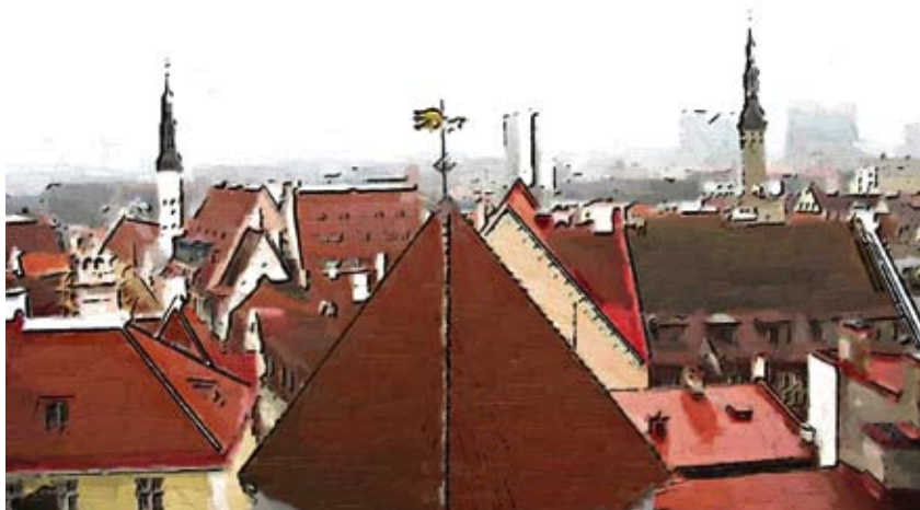
Занявшая второе место работа команды из Таллиннской гимназии Раннику.

Ученики трёх школ в разные дни фотографировали улицы и достопримечательности Старого города. Затем в компьютерном классе обрабатывали фотографии в бесплатном программном обеспечении Gimp. При обработке фотографий использовалась техника «Картина маслом» и «Карандашный рисунок». Лучшие