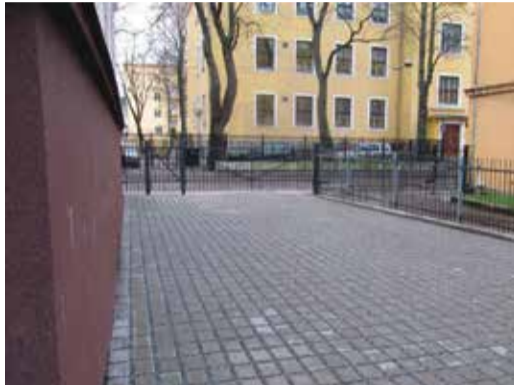
2013. aastal sai projekti „Hoovid korda” kaudu kena kivisillutise Pärna 3 õu.

Üha populaarsemaks muutub jalgratastega liikimine ning käesoleval, 2014. aastal, lubatakse hooviinventari hulgas taotleda toetust jalgratahoidlate ehitamiseks.