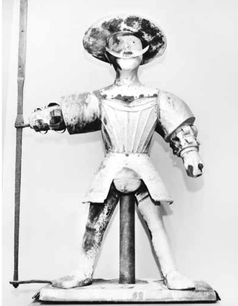
Tallinna Linnamuuseum, Vene tänav 17, www.linnamuuseum.ee/linnamuuseum