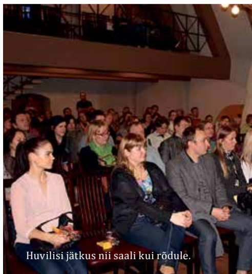
Huvilisi jätkus nii saali kui rõdule.