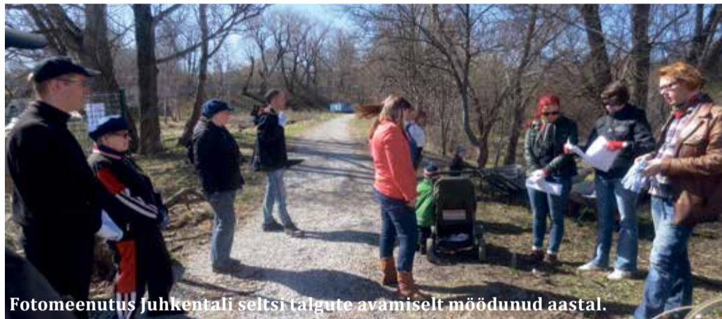
Fotomeenus Juhkentali seltsi talgute avamiselt möödunud aastal.

Seltsi tegevuses osalema on oodatud kõik – selleks ei pea seltsi kuulumagi!