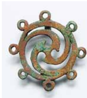
Oksüdeerunud kahjustunud pronksist ketassõlg (3.–4. saj) on leitud Kukrusest.