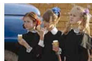
Kaader filmist "Rõdu".

Eesti Ajaloomuuseumi Filmimuuseumis (Pirita tee 56, Tallinn) linastuvad laupäeval, 18. oktoobril kell 13.00 Leedu filmid. Oma filmidest ja Leedu filmiajalooost räägib filmide autor Giedrė Beinoriūtė.