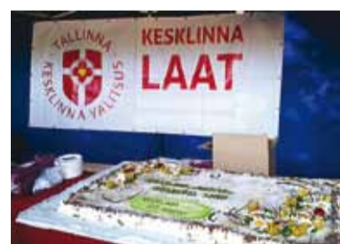
Laadal pakuti külalistele torti, mis kaalus tervelt 25 kilo! Tordi valmistas sponsorluse korras Pagariipoisid OÜ, Tallinna Kesklinna Valitsuse kauaaegne koostööpartner.