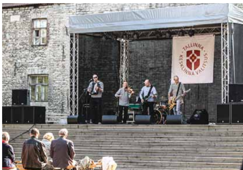
Ярмарочное настроение поддерживал ансамбль Ванавийси.

До встречи на следующей Осенней ярмарке района Кесклинн!