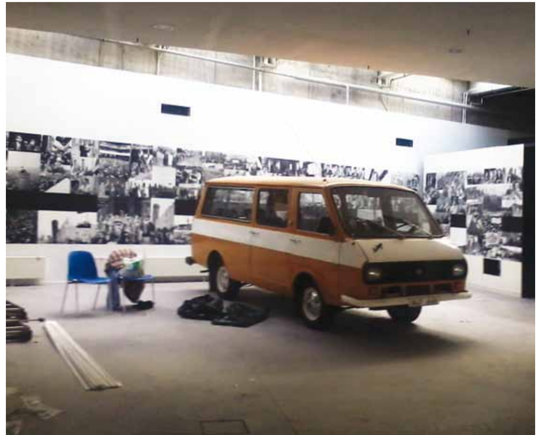
Rahvarinde Muuseumi saalis torkab silma täiesti sõidukorras RAF, millel on oma osa Rahvarinde ajaloo.