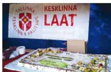
На ярмарке посетителям предлагали торт, который весил целых 25 килограммов! Торт был изготовлен в порядке спонсорства Pagari poisid OÜ.

Районная управа Кесклинн уже в третий раз организовывала ярмарку для жителей района. В прошлые два раза ярмарка проходила на стадионе Калев, теперь же организаторы решили перенести ее прямо в самый центр – на Башенную площадь.