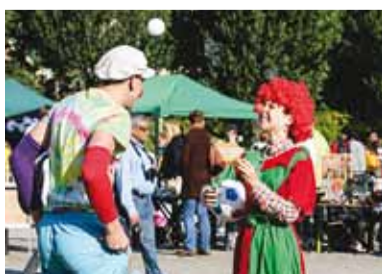
Lapsi lõbustasid klounid.