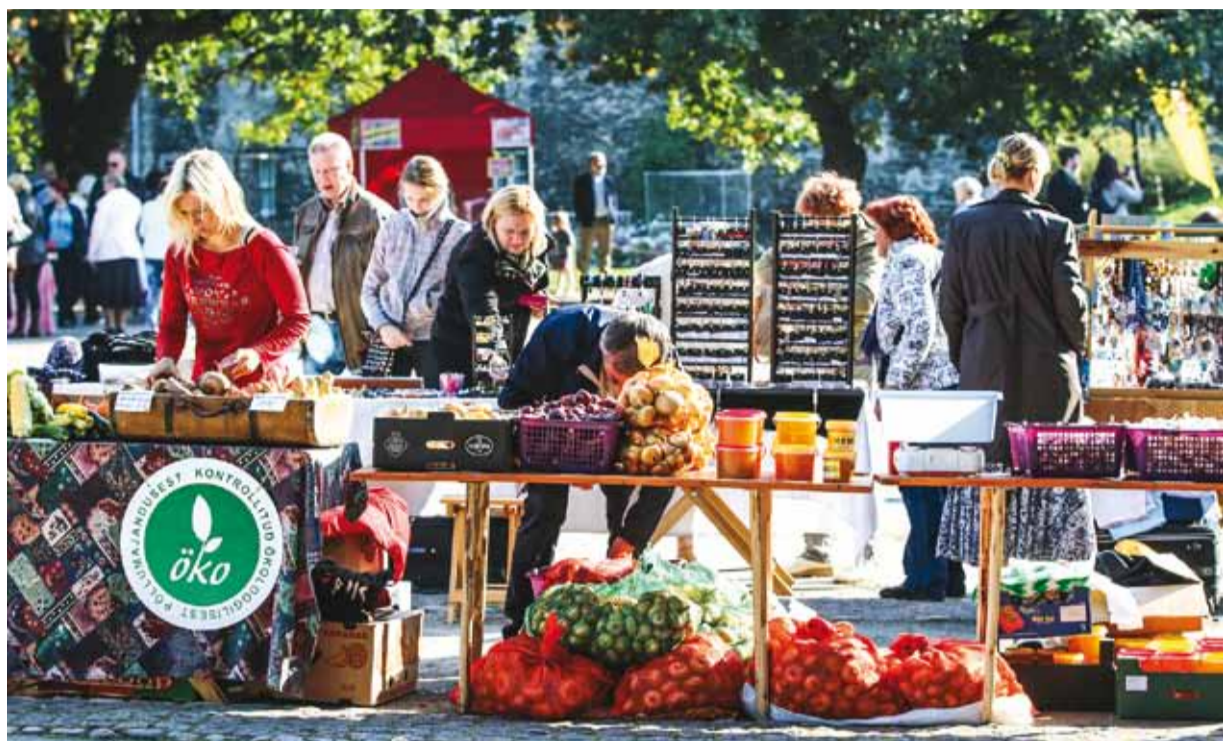
Дары осени на осенней ярмарке.