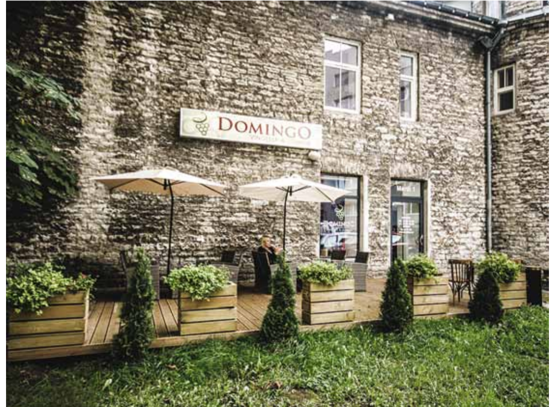
Külluke Lõuna-Euroopat keset Tallinna kesklinna.

Lõunabuffee pakub kreemiseid suppe ja tervislikke salateid. Toeka köhutäie saab maitsevatest paninidest, kergema nälja peletavad suupistevalikud. Kohalik joogikaart