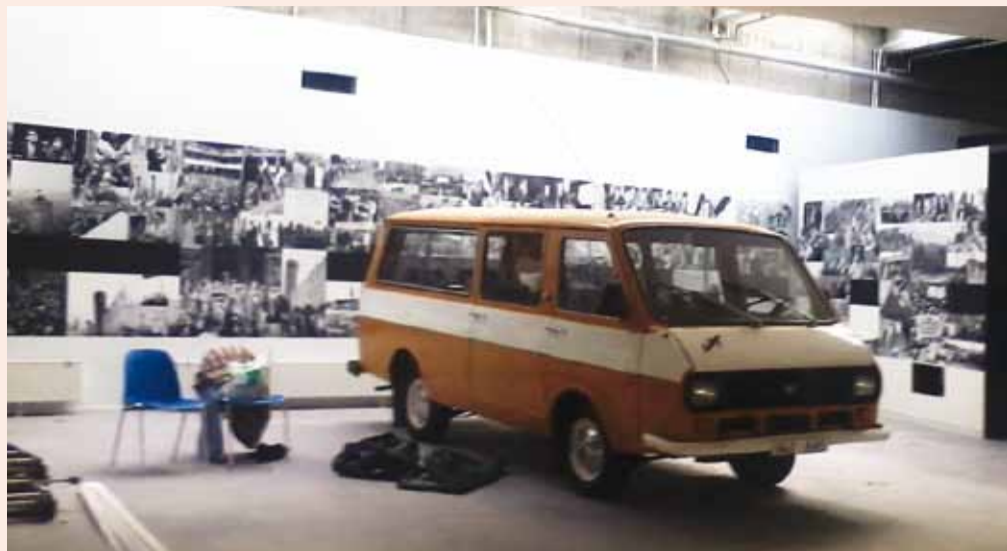
В зале Музея Народного фронта бросается в глаза совершенно готовый к использованию рафик, которому принадлежит своя часть истории Народного фронта

Пожилые посетители музея вспоминают период Народного фронта и говорят: «Вот это было время!» А те, кто помладше, удивляются, действительно ли была вообще возможна такая цепь 25 лет назад?