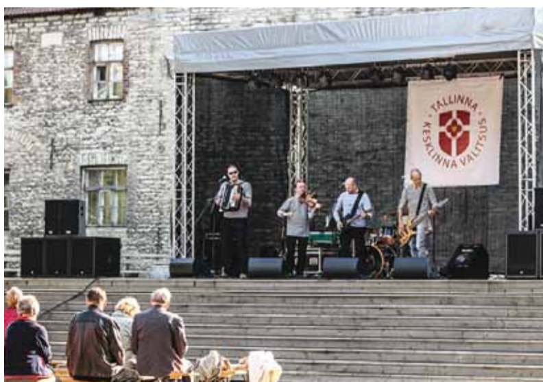
Laadaliste meelt lahutas ansambel Vanaviisi.