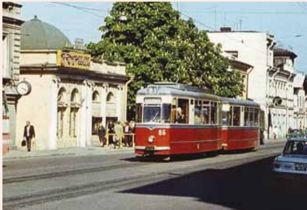
... 1974 ...