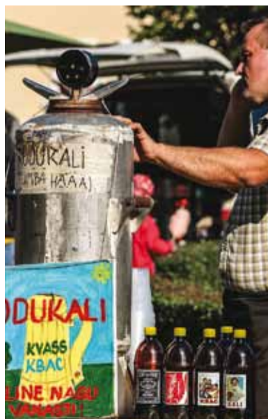
Приятный домашний квас...