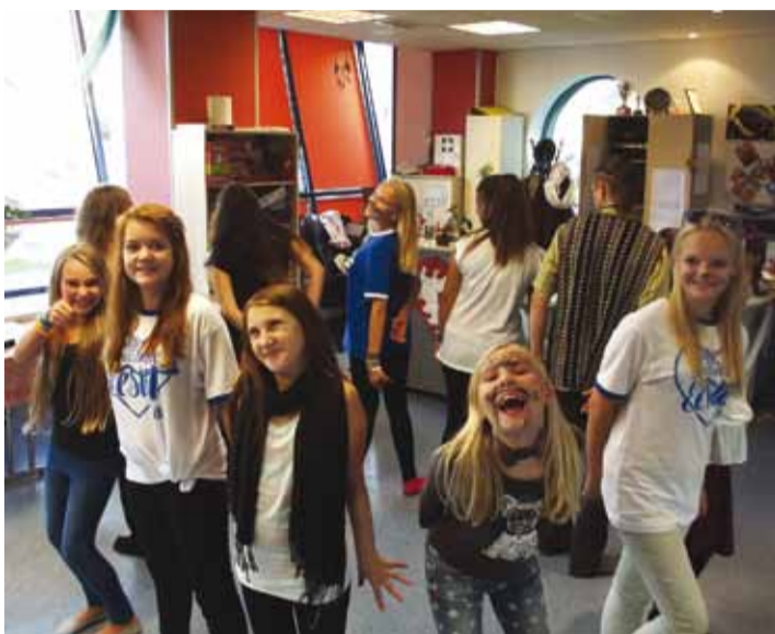
Открытие сезона в молодёжном центре Кристиине.

Полезных занятий хватит также подросткам и взрослой молодёжи.