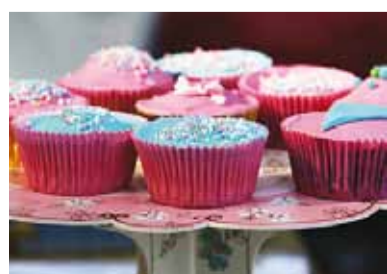
... и прекрасные мафины.