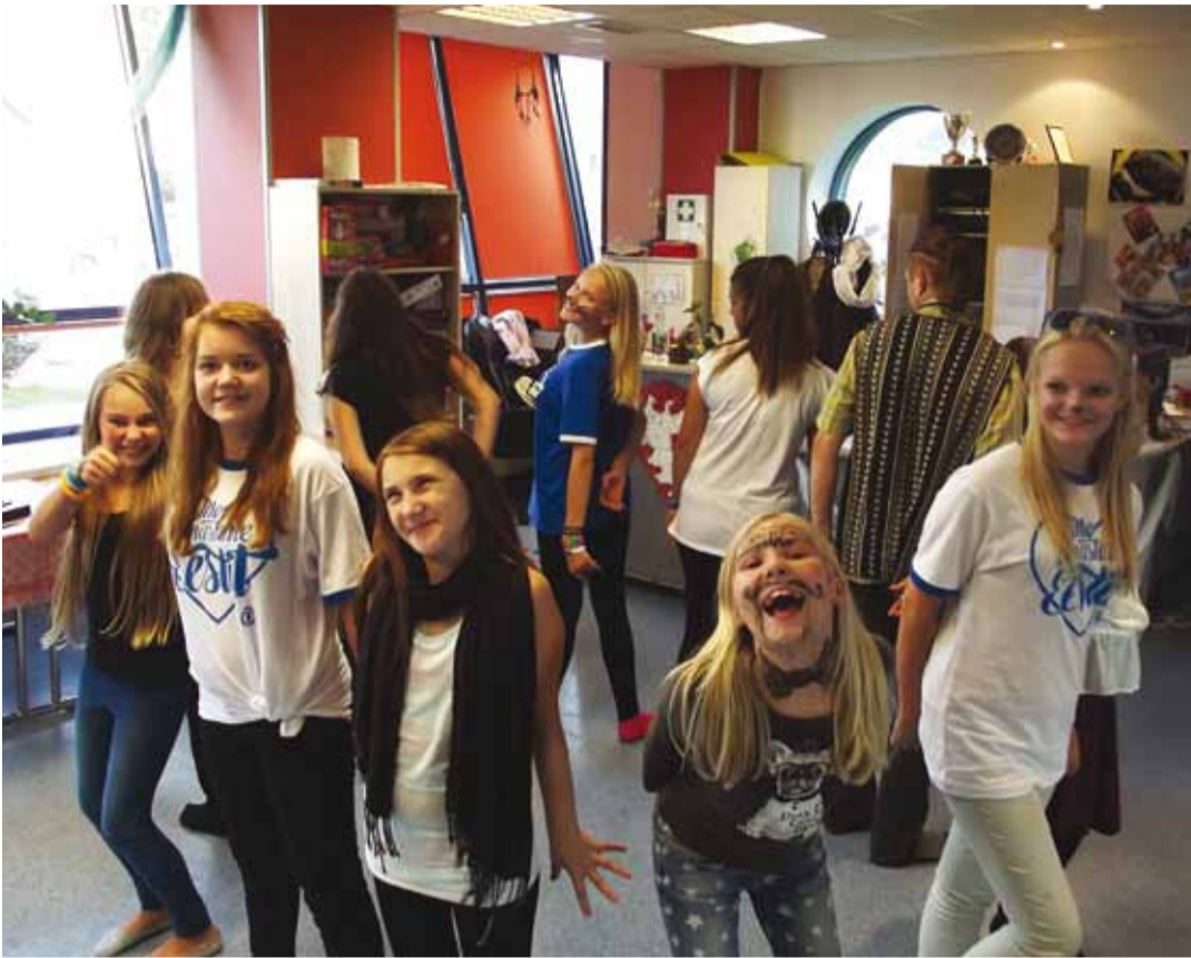
Kristiine noortekeskuse hooaja aväritus.

Kasulikke tegevusi jätkub ka teismeeas ja täisealiste noortele. Soovijatel on võimalus osa saada näiteks filmiõhtutest, osaleda erinevates aktiivõppemeetoditega töötubades või kasutada foto- ja küljendus-kujundusprogramme ning foto- ja videotehnikat.