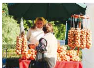
Mahlasid sibulad otse Peipsi äärest.