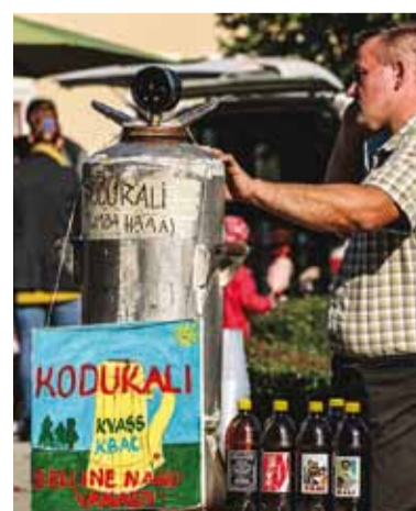
Värskendust sai kodusest kaljast.