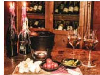
Juustufondüü kerge veiniga.

on arusaadavaks tehtud ka tagasihoidlikumale veinisõbrale. Veinid saavad siia tervest maailmast.