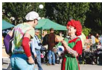
Клоуны веселили детей.