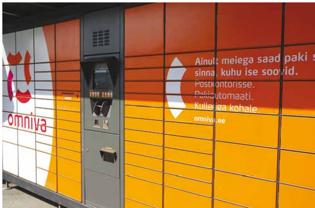
Omniva pakiautomaadid on kesklinnaste teenistuses.

Pakiautomaadiga on võimalik ka pakke saata. Selleks on kõigi pakiautomaatide juures juhendid. Paki saatmise eest saab tasuda pakiautomaadi juures pangakaardiga. Kõi-