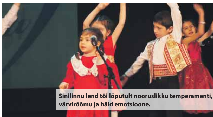
Sinilinnu lend tõi lõputult nooruslikku temperamenti, värvirõõmu ja häid emotsioone.