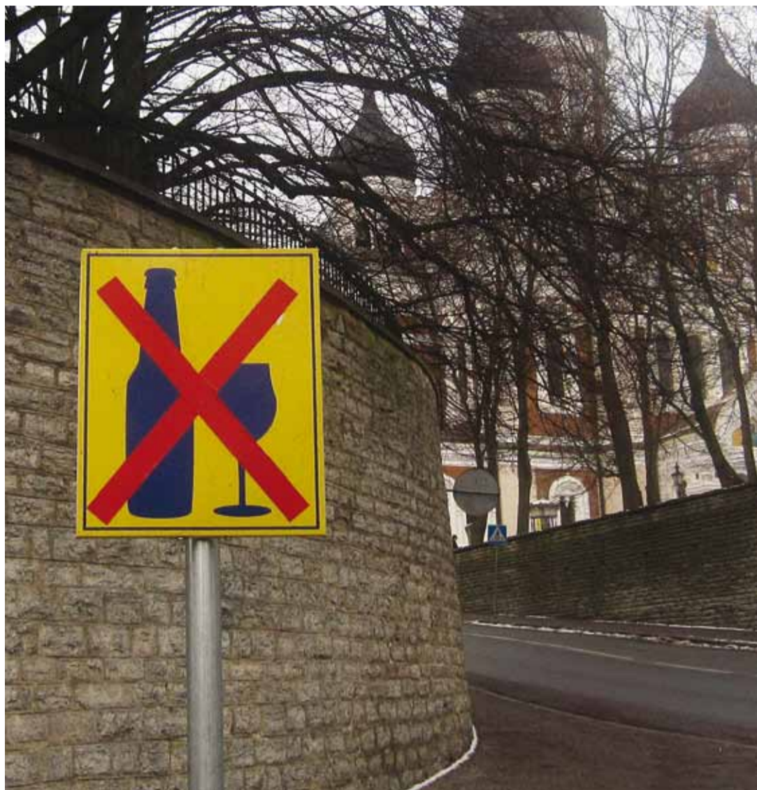
Запрещающий употребление алкоголя знак на Тоомпеа, на углу улиц Фальги теэ и Тоомпеа.