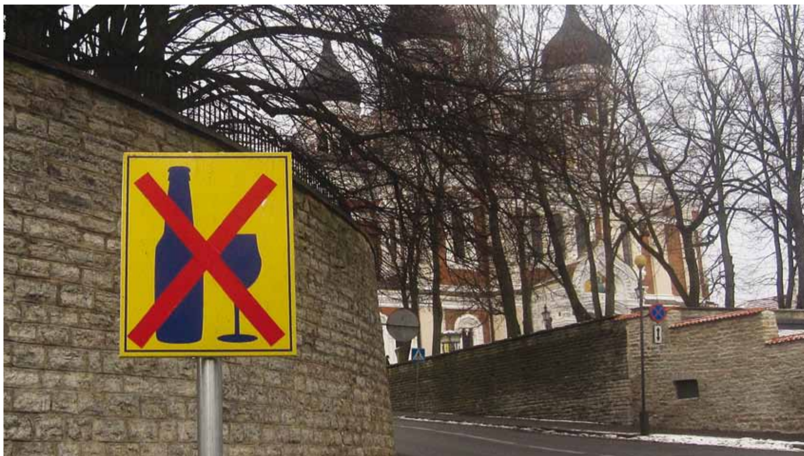
Alkoholi tarbimist hukkamõistetav märk Toompeal, Falgi tee ja Toompea tänava nurgal.