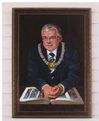
На стене висит портрет Эдгара Сависаара 2010 года, автор Нелли Дрель.