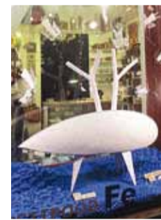
Üks auhinnasaajatest – kunstikauplus Fe Väike-Karja tänaval.

Traditsiooniliselt korraldab Tallinna Keskklinna Valitsus ka sel talvel konkursi parimate jõulukujundusega vaateakende ja fassaadide leidmiseks.