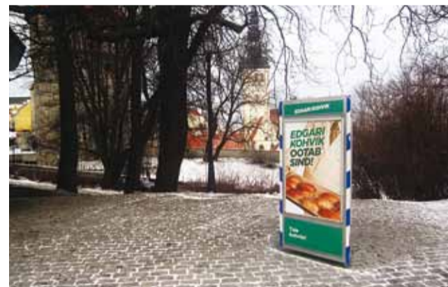
В кафе Эдгара на склоне горы Харью ждут всех.

Снова приближаются выборы. Это означает, что все горожане могут пополнить свои знания и развлечься намного проще, и притом бесплатно. Одно из таких замечательных мест находится на горке Харью – достаточно лишь подняться с площади Вабадусе по лестнице Майери или пройти с Тоомпеа по улице Команданди до башни Кик-ин-де-Кёк, как покажется чудесное парковое кафе. Летом это – совершенно обычное кафе с террасой с прекрасным видом, но сегодня здесь предлагается, помимо кофе, также много привлекательного.