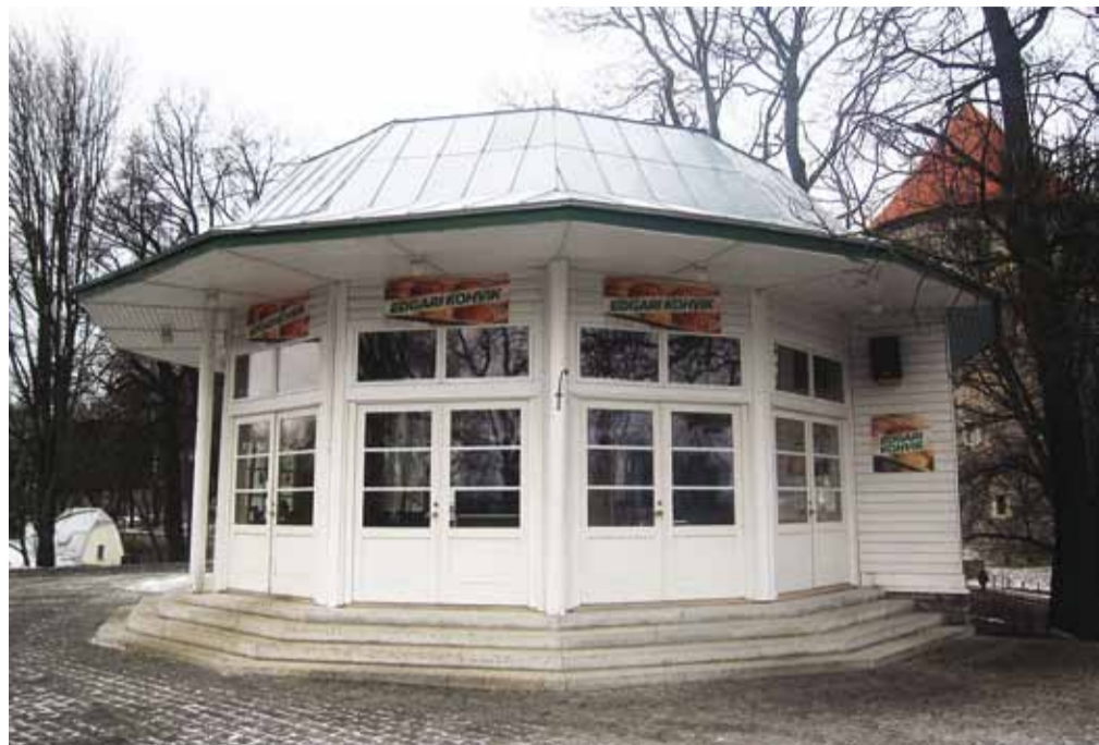
Обычно здесь открыто кафе Кылакода.