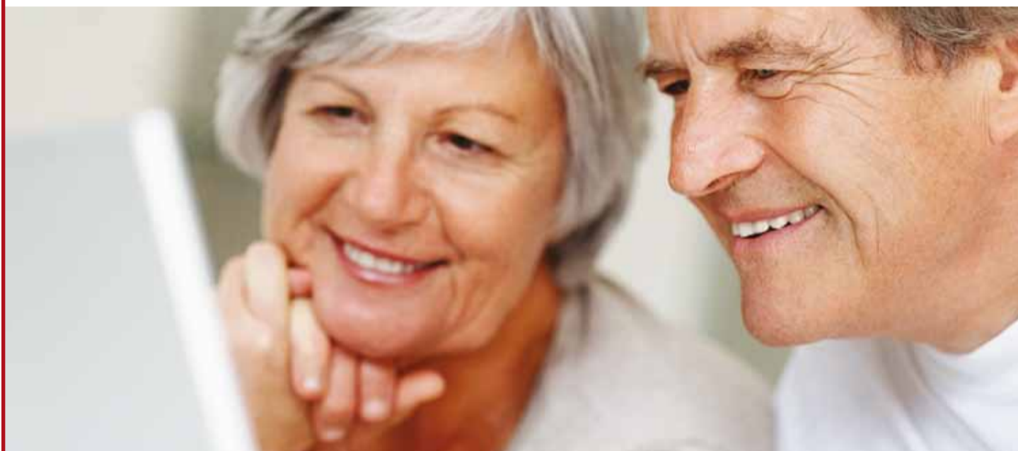
Место проведения – большой зал Дома Хопнера (Ратушная площадь 18).