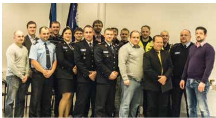
Kesklinna politseijaoskonna abipolitseinikud ja politseiametnikud.

sega. Tema on üks võtmeisikuid selles, et Kesklinna abipolitseinikud on tublid ja aktiivsed. Hanno Viibus on loonud abipolitseinike seas suurepärase õhkkonna ja meeskonnatunde.