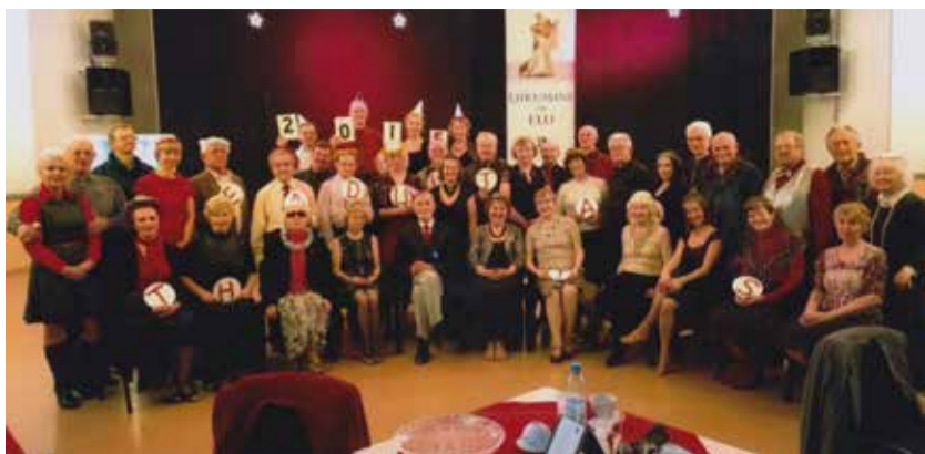
Kaja maja hobitantsijad aasta esimesel peol.