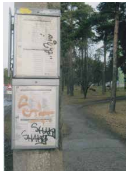
Kunstivõõra inimesena ei saanud ma küll aru, kas see on kunst või midagi muud, aga ega kunst peagi olema üheselt mõistetav.

Loomariigis on kombeks oma territoorium märgistada. Tundub, et nii mõnigi meist ei ole loomariigist kuigi kaugele arenenud. Kas tuleb neile andeks anda, sellega lihtsalt leppida? Või siiski mitte?