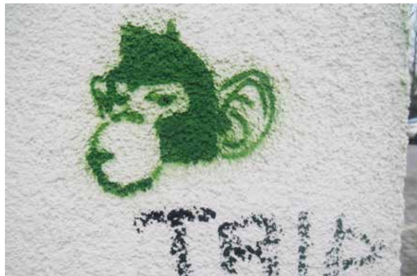
Ilmselt kellegi kena kaaslinlase autoportree.