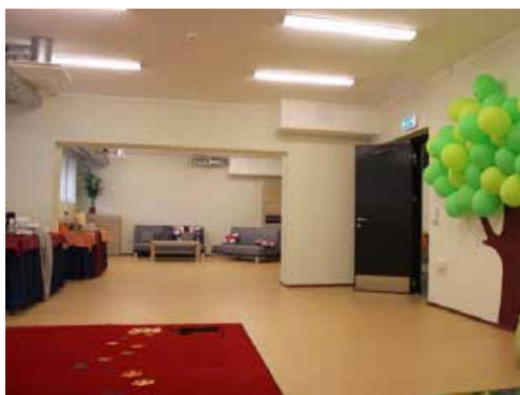
On ruumi, valgust ja avarust.