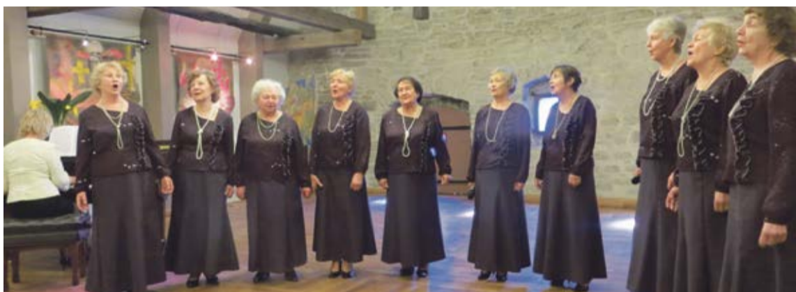
Esineb Kesklinna Sotsiaalkeskuse ansambel Miraaž.