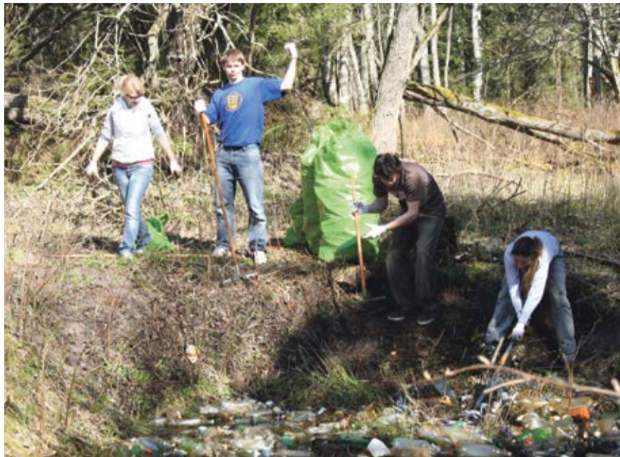
Talgu Aegnal on olnud aastaid väga populaarsed.