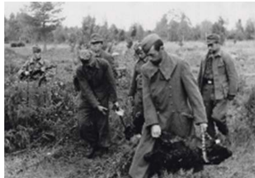
Sõjavangid Saksa okupatsioonivõimu ohvrite laipu kandmas 1944. aastal.

Laupäeval, 25. aprillil kell 13 toimub Eesti Ajaloomuuseumi Maarjamäe lossis (Pirita tee 56, Tallinn) ajaloolaupäevak sarjast „Eesti Teises maailmasõjas”. Ajaloodoktor MEELIS MARIPUU räägib teemal „Repressioonid Saksa okupatsiooni aegses Eestis”.