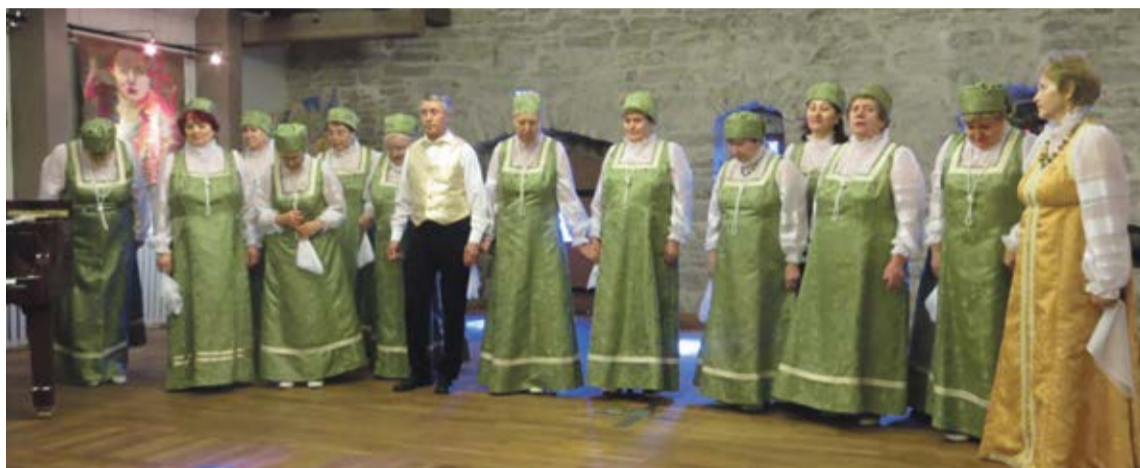
Vaade saali. Esiplaanil Oduvantsikute lauluansambel.

Kontsert sai teoks Tallinna Kesklinna Valitsuse ja Valga Linnavalitsuse vahel sõlmitud koostöökokkuleppe raames, esimene taoline üritus leidis aset Valgas käesoleva aasta jaanuaris.