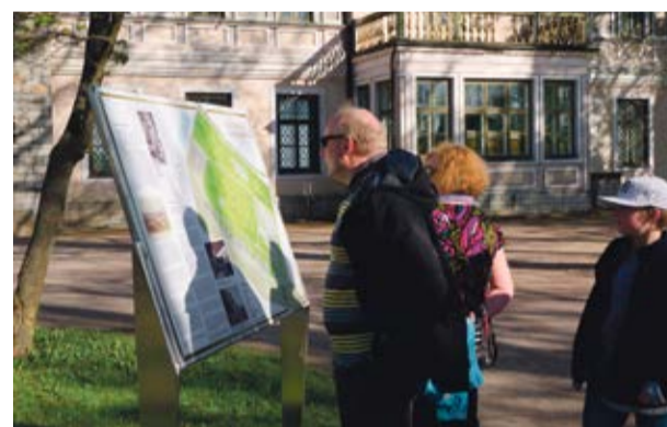
Museumiöö 2014 külalised Maarjamäe lossi õuel. Vahur Lõhmus.