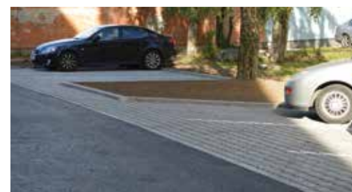
Парковочная площадка квартирного товарищества «Энергия 1».

Желаем сил и успехов всем квартирным товариществам в их начинаниях!