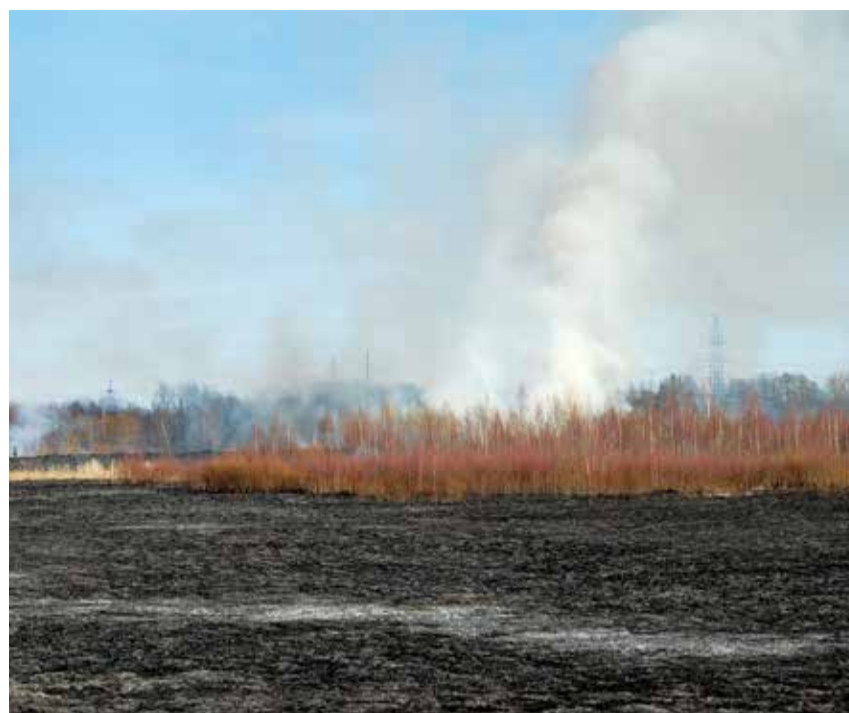
Зачастую ущерб от выгораний старника бывает вызван человеческой небрежностью.

Предварительная регистрация и дополнительная информация – по телефонам 645 7131, 645 7140.