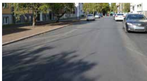
Вид на отремонтированную улицу Кибувитса.

надеемся, что ремонт, которого на этом участке люди ждали несколько десятков лет, сделает движение по этим улицам более ровным и безопасным», – сказал старейшина района Кристийне Вадим Белобровцев.