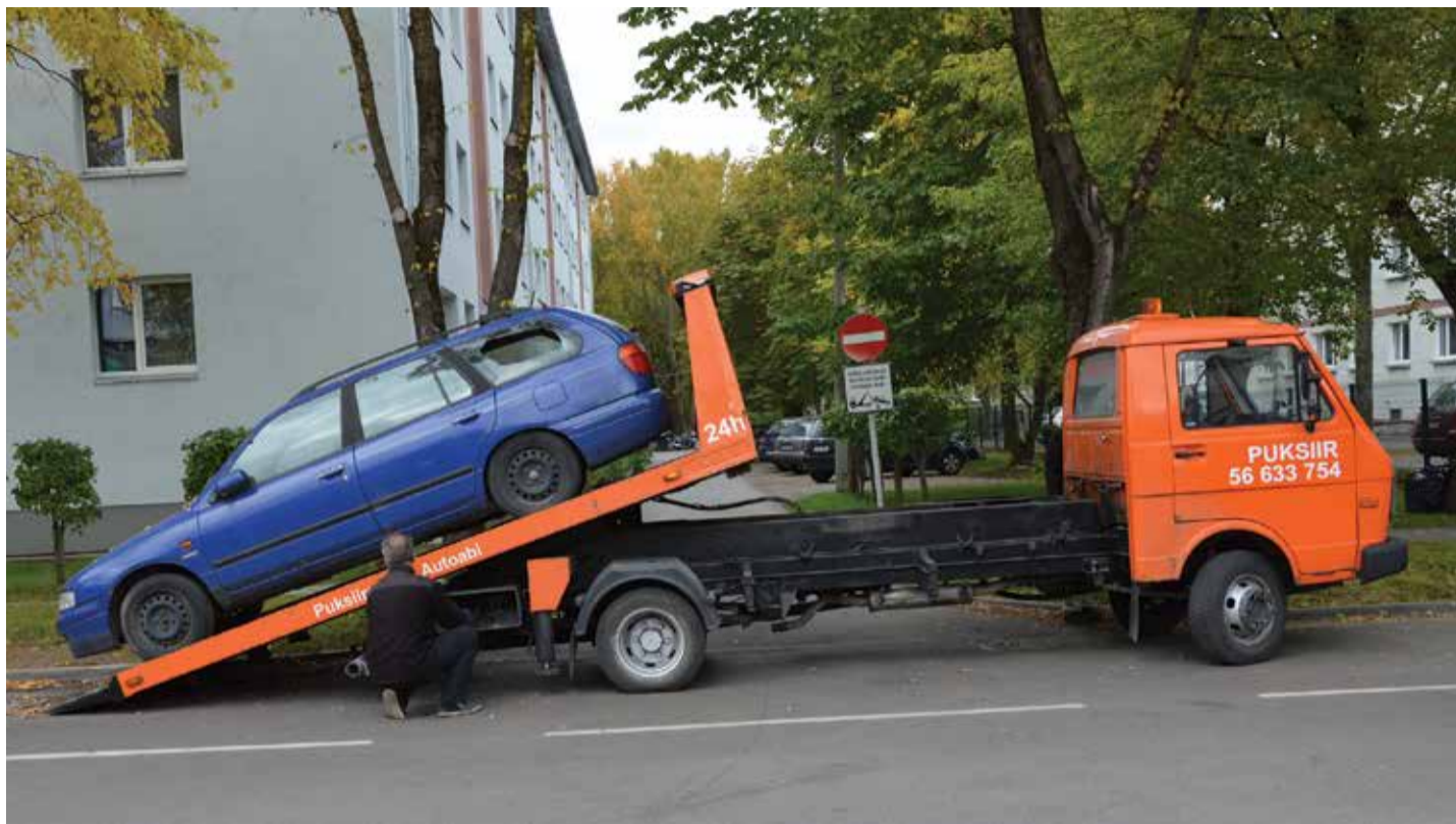
Эвакуация автомобильного лома с улицы Тикутая. Управа Кристийне просит всех жителей сообщать о подобных брошенных машинах.