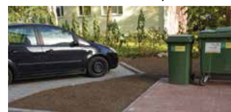
Произведена подготовка для строительства домика для мусорных контейнеров (квартирное товарищество «Энергия 1»).