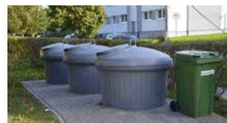
С подачи квартирного товарищества «Энергия 5» установлены заглубленные накопительные контейнеры.

Тем, кто не смог принять участие в обсуждении, важно неторопливо прочесть Строительный кодекс, и в случае возникновения вопросов обязательно обратиться к специалистам Департамента городского планирования.