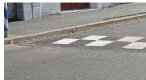
Размеченное дорожное покрытие и сооруженный порог.

В ходе восстановительно-ремонтных работ были удалены старые бордюрные камни и асфальтобетонные покрытия пешеходных дорожек и проезжих частей дороги; отрегулированы высоты коммуникационных и канализационных колодцев вровень с проектной поверхностью, в частичном объеме заменены