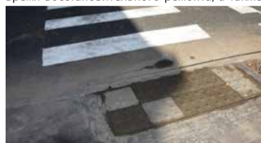
У пешеходных переходов установлены специальные тактильные плиты для слабовидящих.

Заказчиком работ выступал Таллиннский департамент коммунального хозяйства, генеральным подрядчиком – фирма Tallinna Teede AS, надзор над работами осуществляла фирма Teede Projektijuhitumise AS. Стоимость работ составила 343 000 евро.