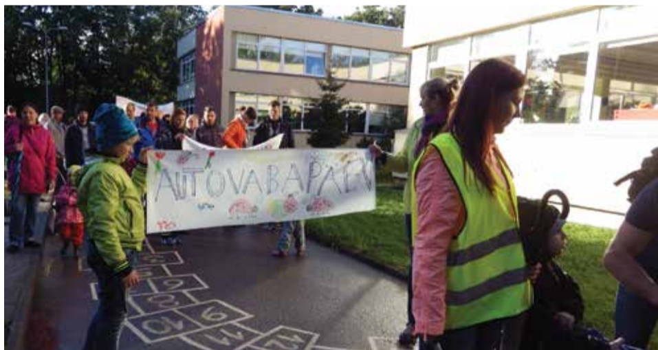
Сбор участников пешего похода из детского сада в парк Лёвенру в День без автомобилей.

Поход, посвященный Дню без автомобилей, стал первым семейным днем, проведенным за пределами территории детского сада. Несмотря на капризы погоды, участие в нем приняло в общей сложности 110 детей из детского сада «Лепатрийну» вместе с папами и мамами, сестрами и братьями, бабушками и дедушками. Большое спасибо всем участникам!