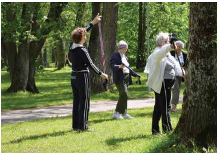
Тренировка начинается с упражнений на растяжку.

Проект финансировали Управа района Кристийне и Таллиннский департамент социальной помощи и здравоохранения.