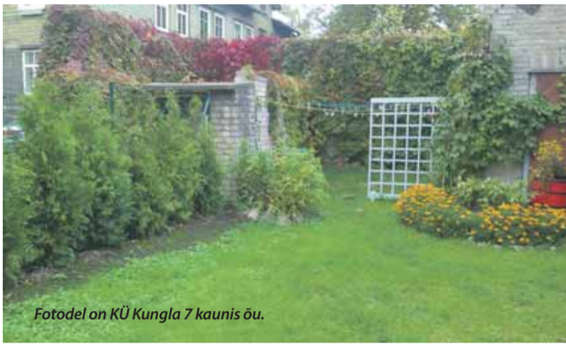
Fotodel on KÜ Kungla 7 kaunis õu.