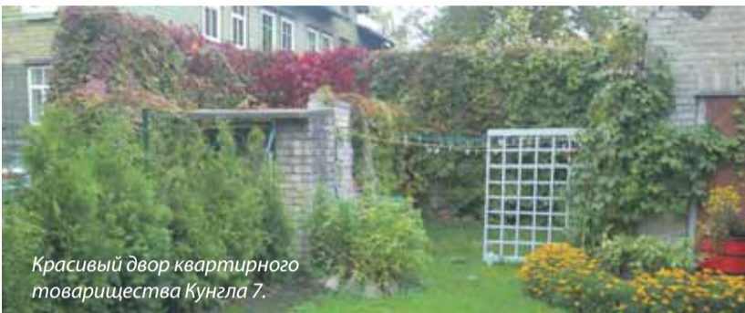
Красивый двор квартирного товарищества Кунгла 7.