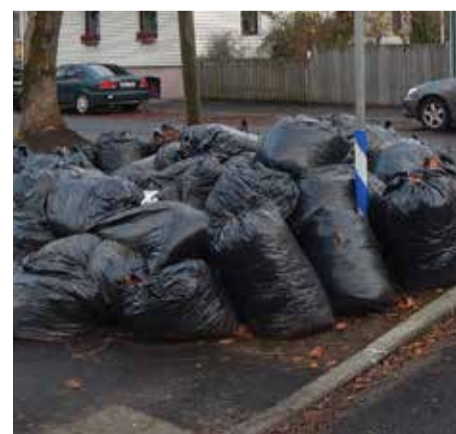
Опавшие листья необходимо собирать и компостировать на своем участке, или же самостоятельно вывезти на ближайшую станцию переработки отходов. Организованный вывоз листьев в районе проходит весной.

Подробную информацию о субсидии на обновление электроустановок можно найти на сайте целевого фонда KredEx www.kredex.ee.