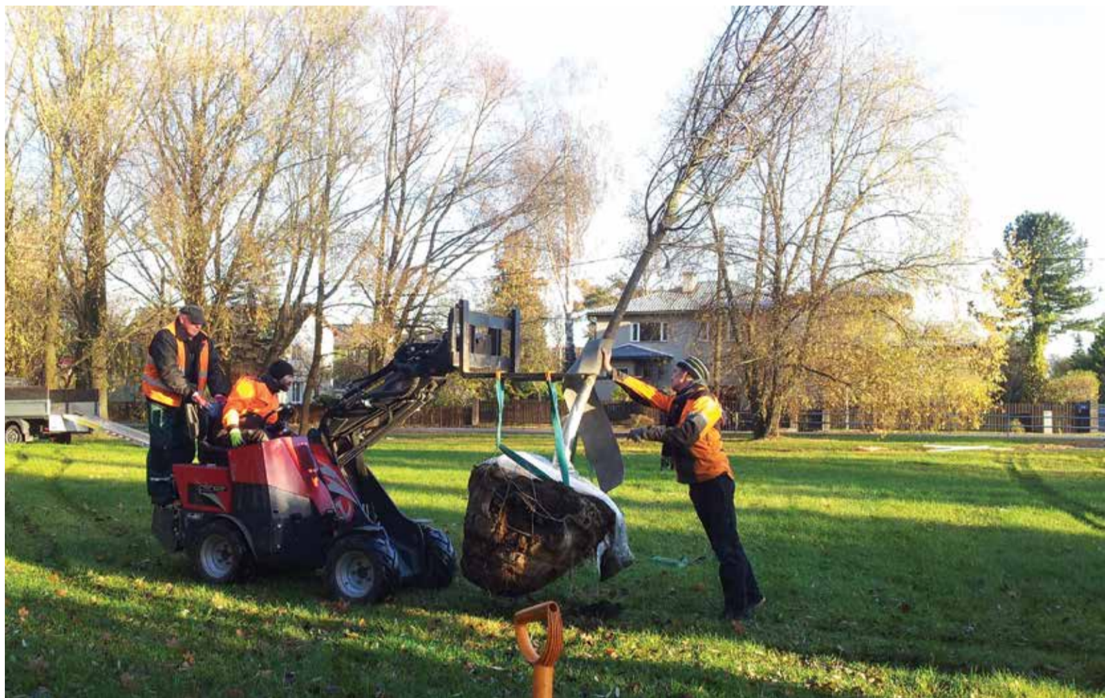
Стройная липа обрела новое место жительства в парке Лёвенру, рядом с улицей Альги.