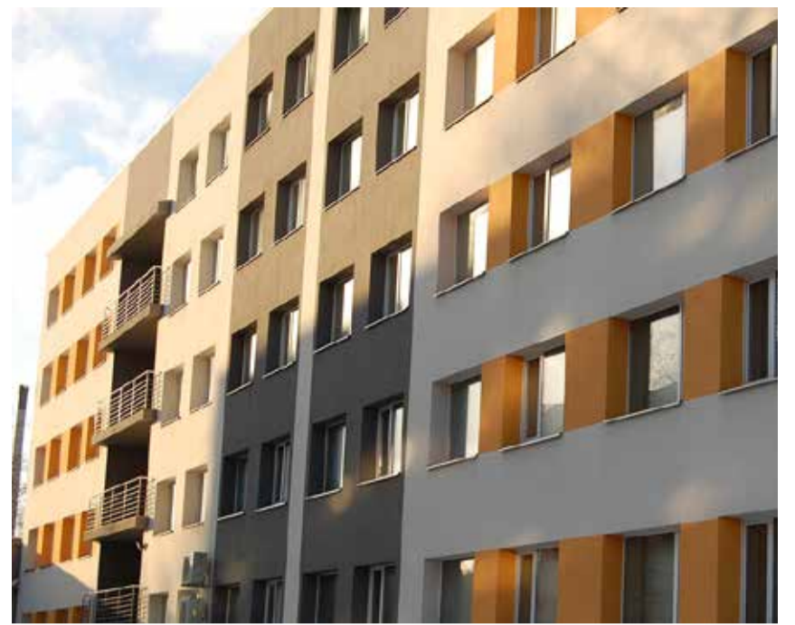
Студенческое общежитие ТТУ «Сийдисаба» служит домом для 170 иностранных студентов.