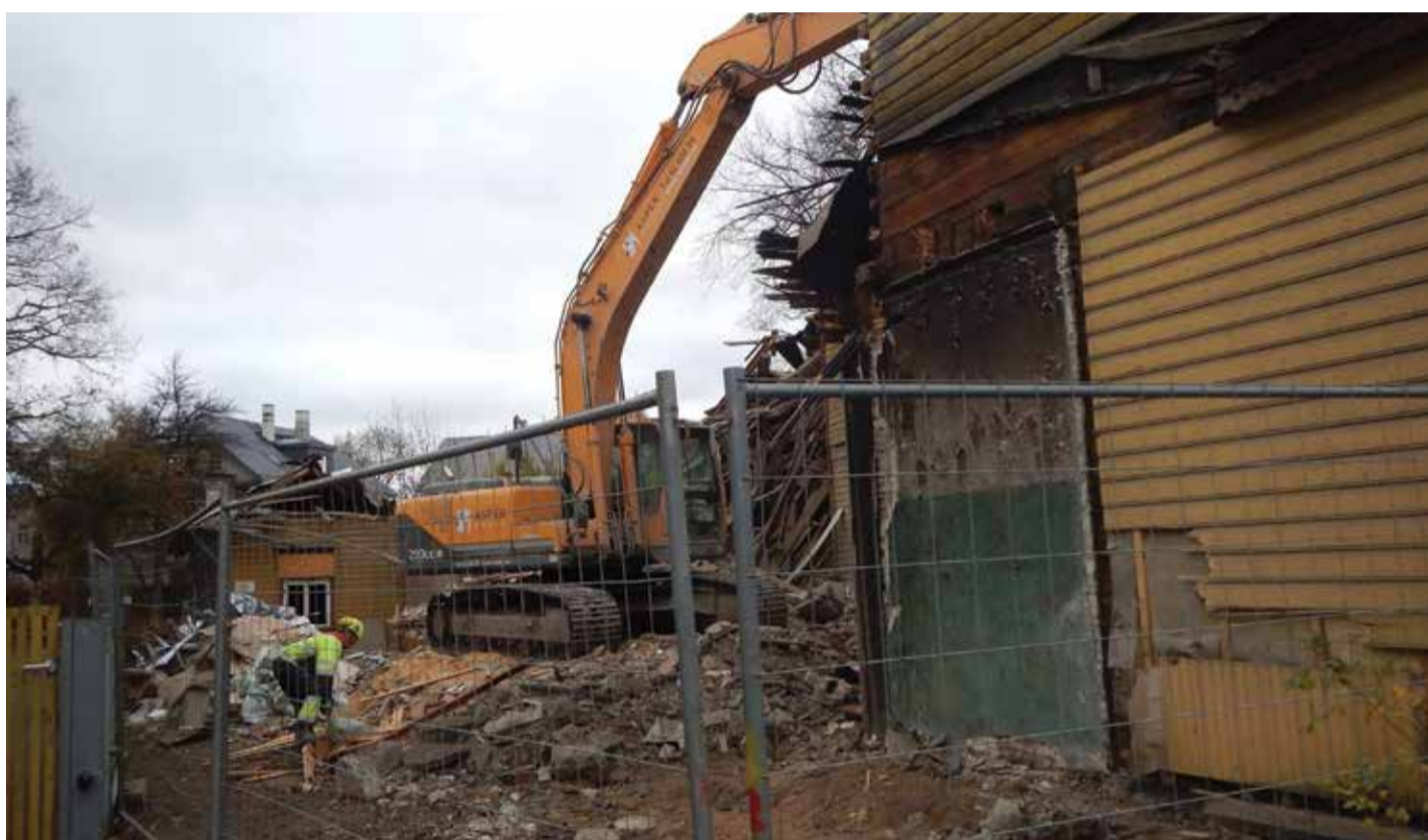
Наконец-то снесено опасное здание, которое несколько раз горело, подвергая опасности соседей. Палдиское шоссе, 39 / Мадара, 5.

Свой адрес в регистре народонаселения можно проверить через портал eesti.ee, там же можно подать заявление о регистрации по новому адресу. В случае возникновения вопросов можно обратиться к регистратору управы части города (телефон 645 7127).