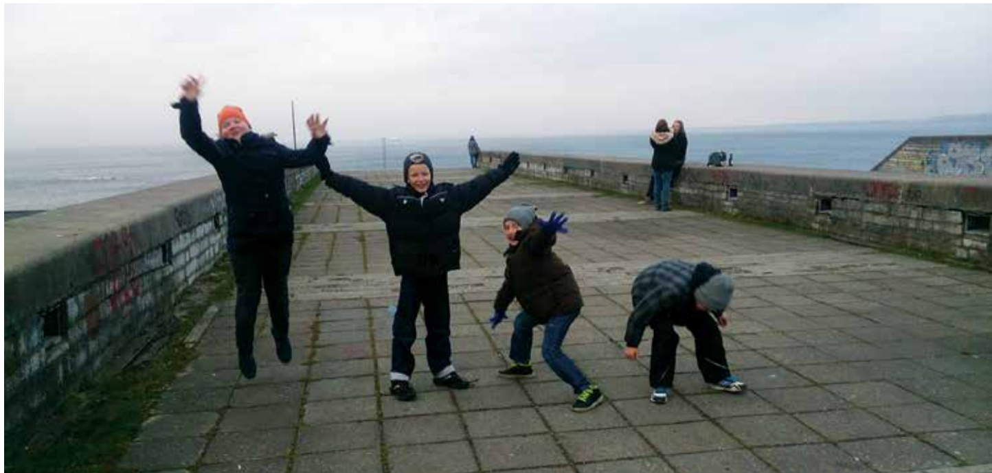
Чудесная осенняя погода позволила провести школьные каникулы на улице.

Желаем всем детям и их родителям деятельного и успешного продолжения учебного года!