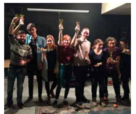
Noortekeskuse esimene sünnipäev.