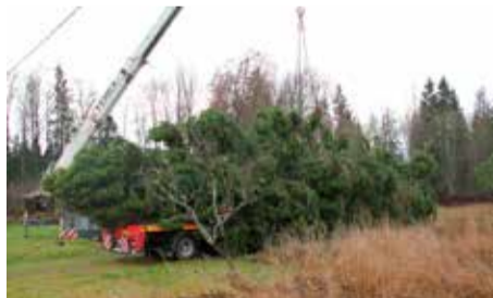
Jõulukuuse toomine linna.

Tänavune jõulukuusk on Kose vallast ning see jõudis 11. novembril Raekoja platsile.