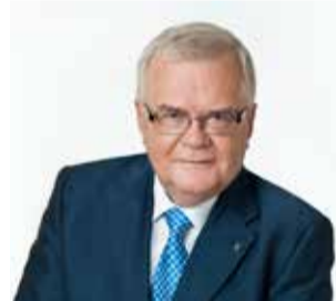
Эдгар Сависаар мэр Таллинна

Желаю прекрасного наступающего Рождества!