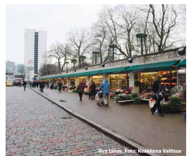
Viru tänav.

Kesklinna valitsuse avalike suhete nõunik