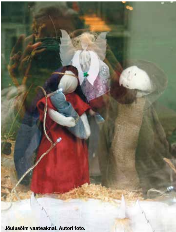
Jõulusõim vaateaknal.

Advendiaja alguses avatakse Kloostri Aidas pidulikult jõulusõimede näitus. Laste tehtud jõulusõimed on välja pandud Vene ja Apteegi tänavate kohvikute, poodide, käsitöökodade ja koolimajade akendele. Sellist kogu tänava muutmist näitusesaali pole teadaolevalt Eestis varem aset leidnud.