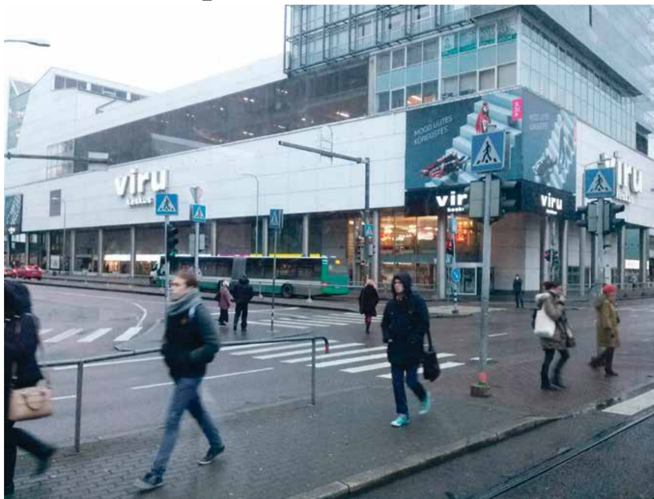
Hobujaama ja Narva mnt ristmik.

Tallinna peatänavaks on Narva maantee ja Pärnu maantee kesklinna lõik Liivalaia ja Pronksi tänavate vahelises osas (kinost Kosmos kuni Jõe tänavani). Seni pole ühelegi tänavale peatänava tiitlit antud ning nimetatud lõik vastab kõige enam linna peatänava asukohale ja iseloomule. Pärnu ja Narva maantee käsitletav lõik on täna mürarikas, haljastuseta, kitsaste kõnniteedega ja ilma rattateedeta autokeskne linnaruum, mida on alates 1960. aastatest planeeritud vaid autode perspektiivist: üha uuesti ja uuesti on antud autodele juurde ruumi jalakäijate arvelt. Puuduvad välikohvikud, istumiskohtad, tänavahaljastus ja inim-mõõduline disain, mis on omane Euroopa pealinnadele. Jalgsi ja rattaga liikumine on ebamugav, lausa eluohutlik. Maanteeameti andmetel on näiteks Hobujaama – Laikmaa ja Narva maantee ristmik Tallinna kõige ohtlikum. Seal juhtub kõige rohkem inimvigastustega liiklusõnnetusi.