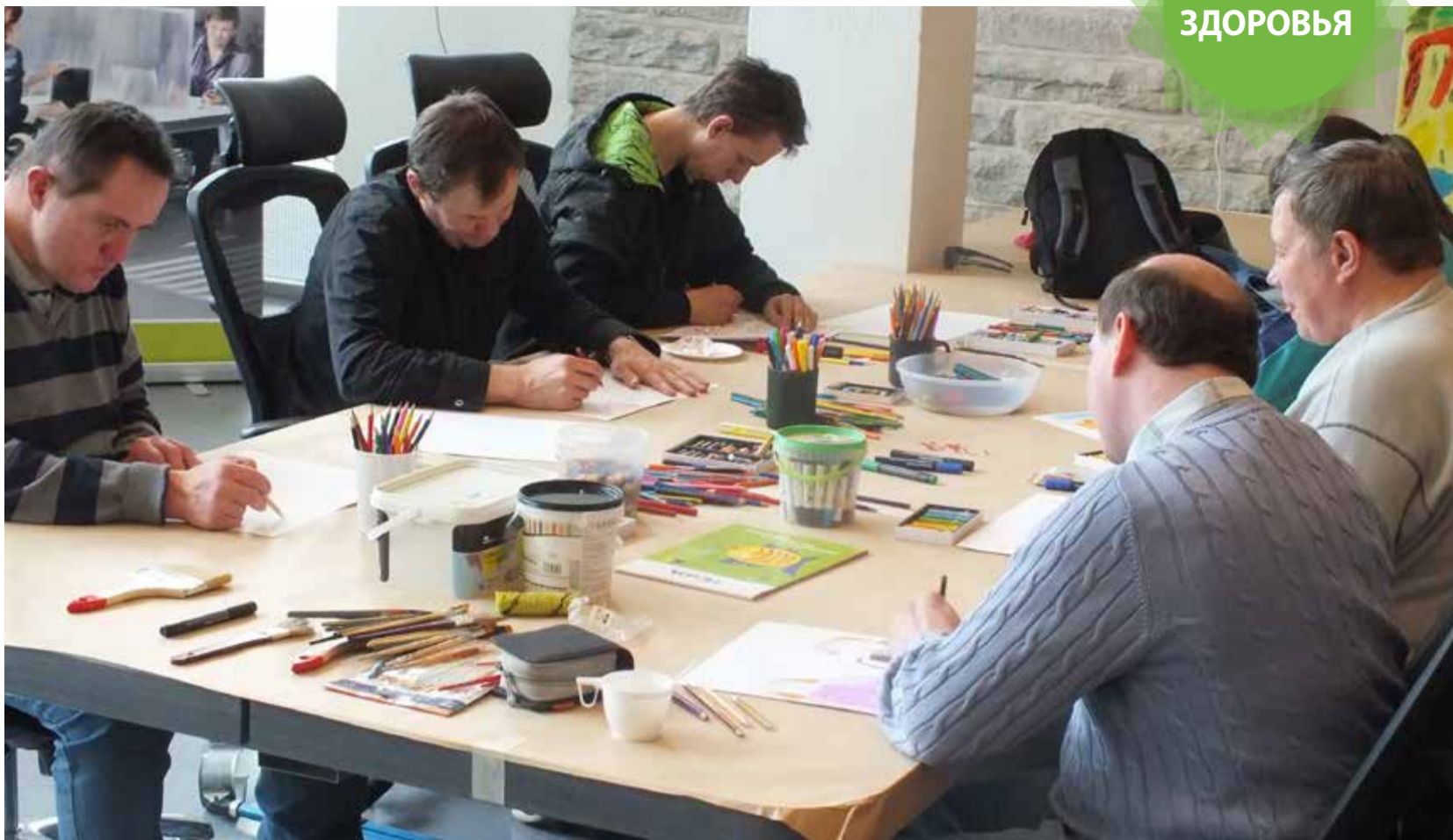
Tugiliisu предоставляет возможность для самосовершенствования путем искусства: так рождаются произведения искусства.