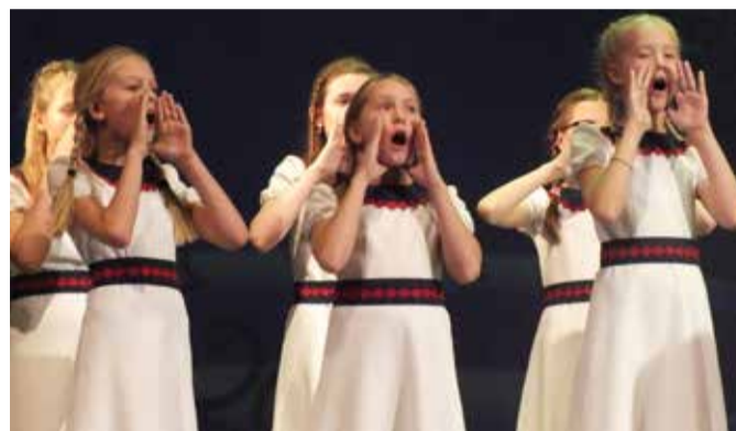
Торжественные и греющие душу: на фото мгновенья эстоно- и русскоязычных рождественских мероприятий Пыхья-Таллинна. Русскоязычный рождественский праздник вели Дед Мороз и Снегурочка, на эстоноязычном мероприятии большие впечатления оставили юные исполнители детского хора ЭТВ.