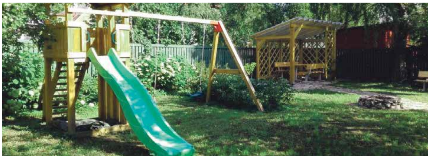
Самым деятельным квартирным товариществом 2015 года в районе Кристийне было КÜ Моопи 19, которое отличилось хорошо продуманной целостностью. Они создали красивый двор и зеленую зону.

Спасибо всем тем, кого мы в этом году отдельно не отметили, но кто ежедневно вносит свой важный вклад в деятельность своего квартирнотоварищества!