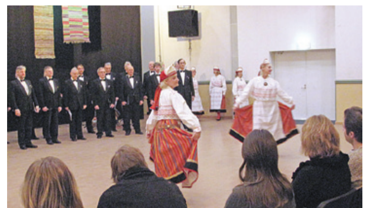
Управа Мустамяэ в честь годовщины Эстонской Республики организовала 21 февраля для всех мустамяэсцев концерт в культурном центре «Кая»: выступали мужской хор Тюрнпу и женский танцевальный коллектив Pääsuke.

Наш путь - заботиться друг о друге, а также строить Эстонию на знаниях. Не так давно нашим образованием любовались так же, как сейчас любуются финским. Почему нашей следующей целью не может быть лучшая в Европе система образования, самый здоровый и честный народ в Европе? Приучимся каждый день думать о том, что нас мало, что каждый человек для нас важен,