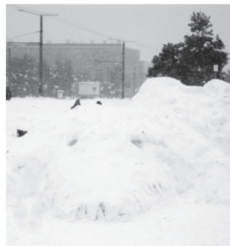
Lumelinna peateemaks oli „Loomad ja linnud Männipargis“. Темой снежного городка были «Животные и птицы в парке Мяни».

Отдельное спасибо Coca-Cola HBC Eesti, фирме Pagariipoistid и Kaitseliidule.