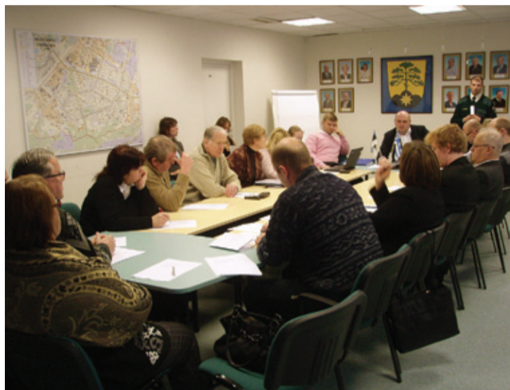
Заседание административного совета Мустамяэ.

В трудные времена простые и хорошие мысли необходимы, и их, несомненно, еще много. На собраниях комиссии по вопросам окружающей среды я всегда приглашаю товарищества, активистов – некоторые уже приходят, но место есть и для других. Заинтересованные лица могли бы сообщить мне об этом ( gerd@gerdtarand.eu ), я с радостью приглашу их в следующий раз. Может, таким образом мы претворим в жизнь и какую-нибудь твою идею?