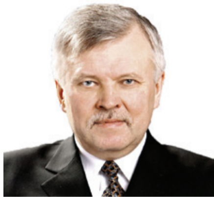
Юри Пихл, вице-мэр Таллинна

Различными законами и предписаниями на местное самоуправление наложена обязанность контролировать деятельность людей с целью обеспечить благополучие жителей и гостей самоуправления.