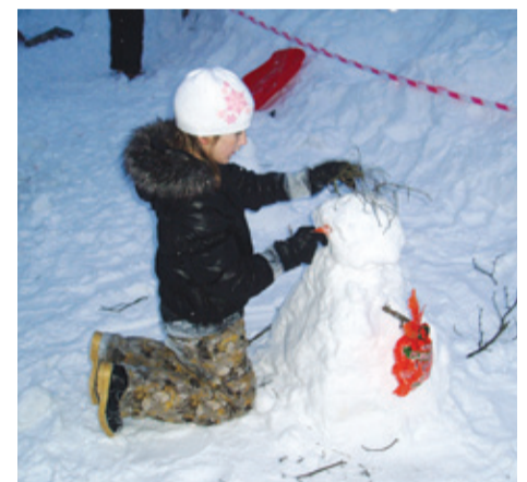
Vastlatralli alguses kuulutati välja Lumememme ehitamise konkurss, millest võttis osa 10 võistkonda. В начале праздника был объявлен конкурс на лучшего снеговика, в котором участвовало 10 команд.