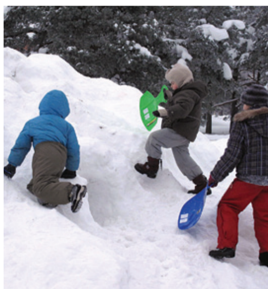
Kommentaarid on liigsed. Без комментариев.