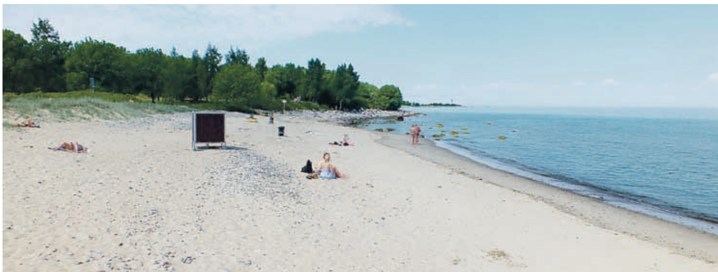
Пляж Пикакари расположен на полуострове Пальяссааре возле Екатерининского пирса. 📍