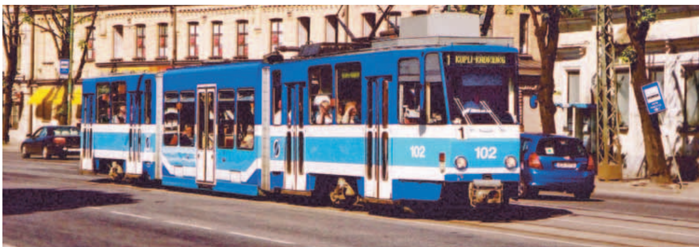
В результате масштабной реконструкции трамвайных путей новые трамваи появятся и в Пыхья-Таллинне.