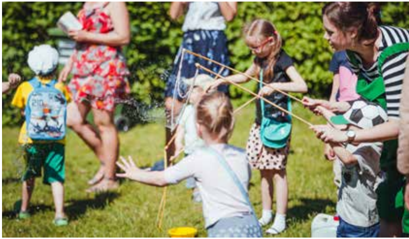
Дни Старого города предложили множество занятий и детям.

«Дни Старого города можно действительно считать удавшимися. Многообразная культурная программа и по-летнему приятная погода привели в Старый город очень много гостей как из Таллинна и со всей