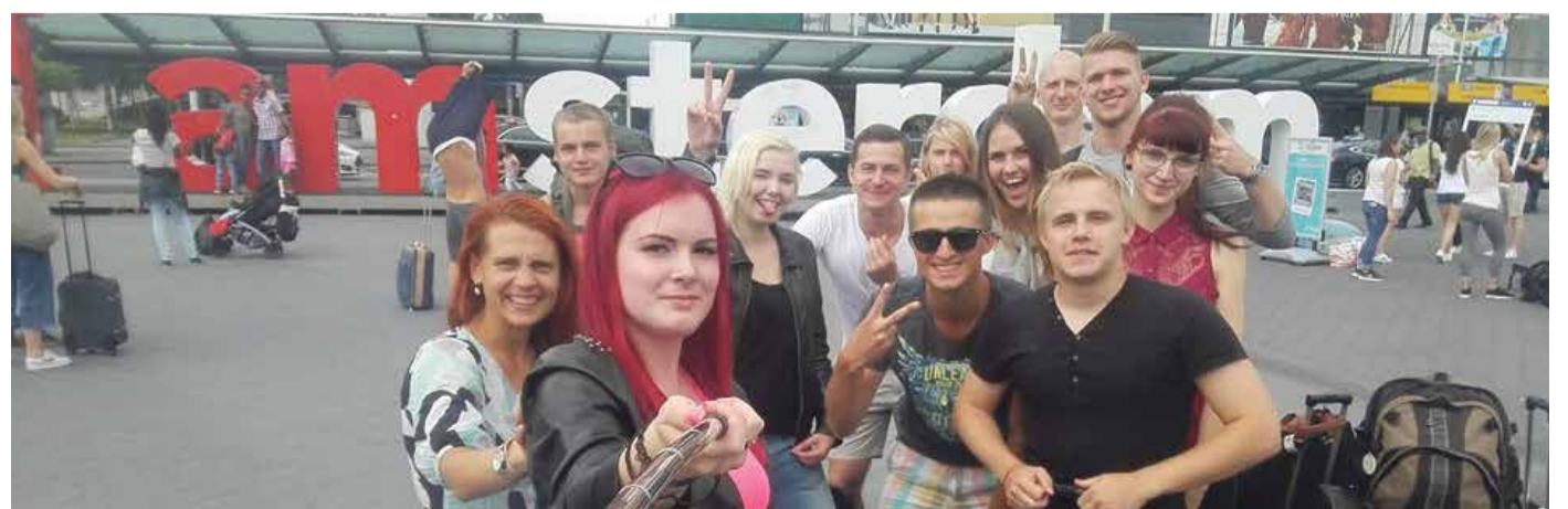
Молодежный центр Кристийне принял участие в международном проекте по молодежному обмену Re-Cycling.

Помимо неформального обучения, у молодых людей и девушек была возможность увидеть столицу Нидерландов Амстердам, посмотреть на тюленей и познакомиться других участников со своими традиционными блюдами и напитками.