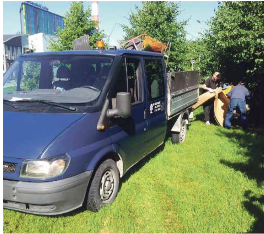
АО Mustamäe Haljastus проводит работы по уборке зеленой зоны в окрестностях магазина Marja.

Что касается расположения скамеек, то здесь мы получили много предложений от горожан. Вы по-прежнему можете отправлять нам свои пожелания по адресу kristiinelov@gmail.com, или же пишите нам в Facebook, где наша страница называется Kristiine Linnaosa.