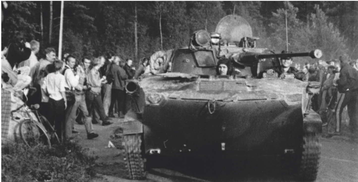
От Телебашни отъезжают псковские десантники на бронемашинах.