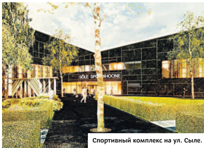
Спортивный комплекс на ул. Сыле.

С реконструкцией зоны отдыха на Штротке тесно связано и будущее пляжного здания. Нынешнее строение