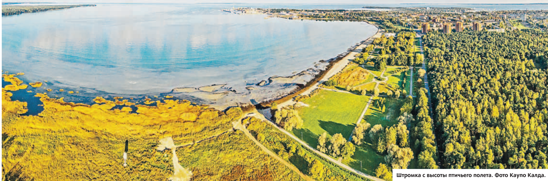
Штротка с высоты птичьего полета.