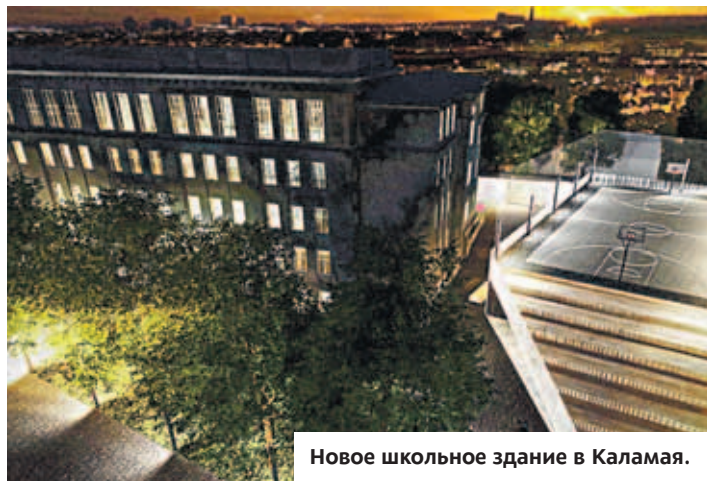
Новое школьное здание в Каламая.

Если у вас возникли вопросы, связанные с бюджетом на 2017 год, то свяжитесь с нами: управа Пыхья-Таллинна, ул. Нийне 2, 10414 Таллинн. Телефон 645 7040, e-mail: pohja@tallinnlv.ee, страница в Фейсбуке: facebook.com/ptallinn. Непременно ответим на все вопросы! ■