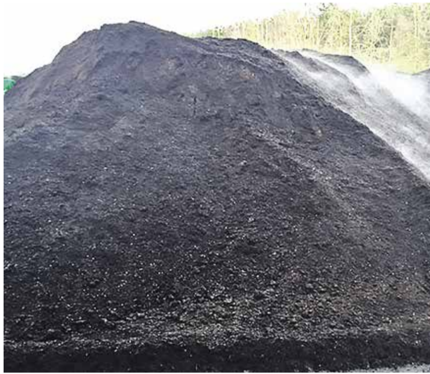
Toodetud kompost ei sisalda reoveeset, see sobib aiamaale ja haljasaladele.

Jäätmete taaskasutuskeskus ei asu kaugel – sõit linna piirist siia võtab kõigest 10–15 minutit. Ka jäätmete üleandmine käib lihtsalt ja kiiresti. Selles abistavad ning juhendavad teid lahkelt meie töötajad.