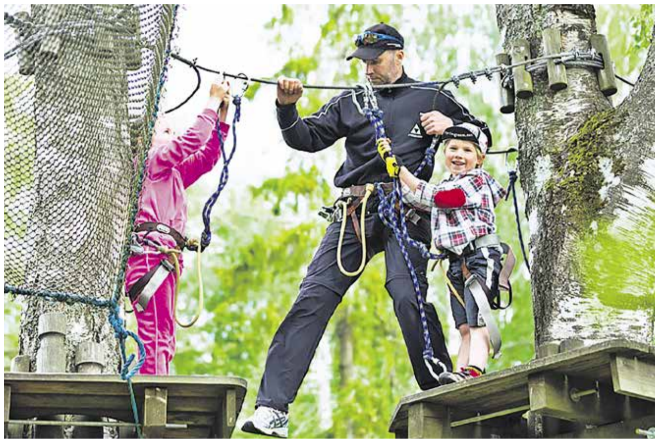
Lastele meeldib, kui vanemad nende mängu kaasa teevad.