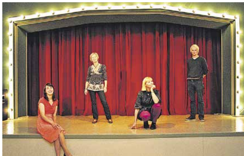
Kultuurikeskuse kontorirahvas hooaja alguses uue näo saanud saalis.

Huviringe on majas palju, ruumi jagub aga ka uutele tulijatele. Sellel sügisel alustavad uudisena 6–11-aastaste laste rahvatantsuring Katrin