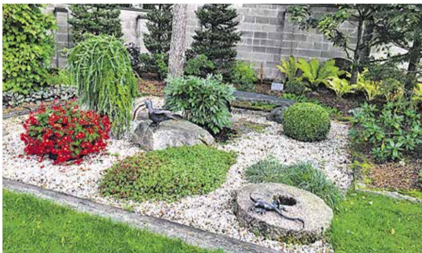
Kolmas koht Sisaski 24c aed.