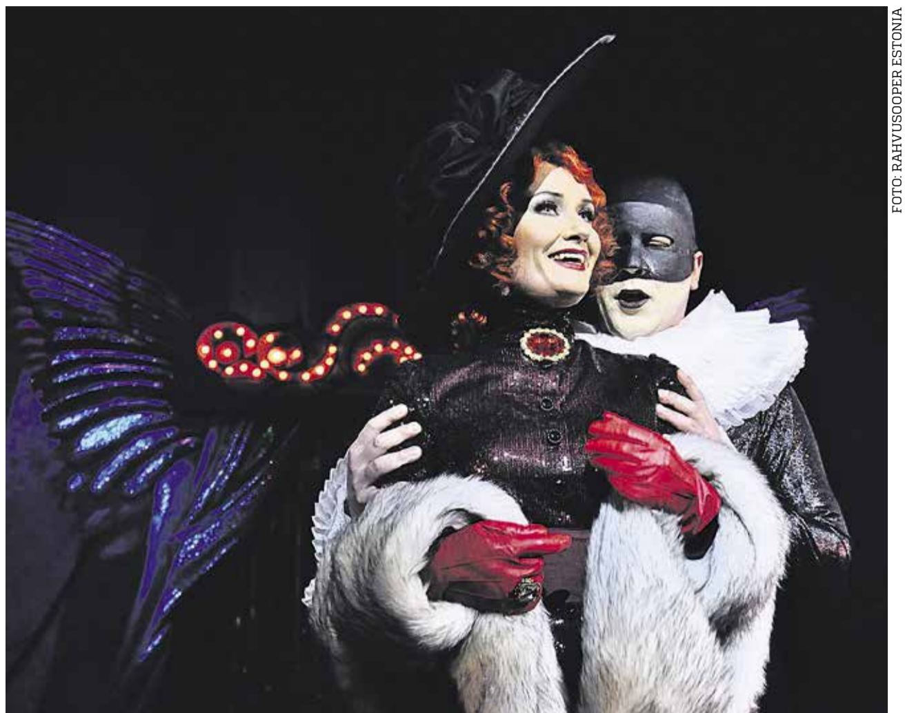
Kontserdil saab kuulda rahvusoperi Estonia operetikava «Ja klaasides sädeleb vein».

Loomulikult on kümme kotti kõikide mahalangenud lehtede ja okaste äraviimiseks liiga vähe, aga arvestama peabki, et see kampaania on elanikke abistav ja toetav ettevõtmine, mitte et linnaosa oleks kohustatud kõik lehed ära viima.