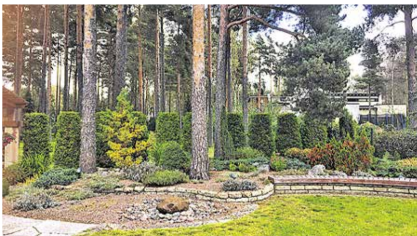
Teine koht Soovildiku 9 aed.