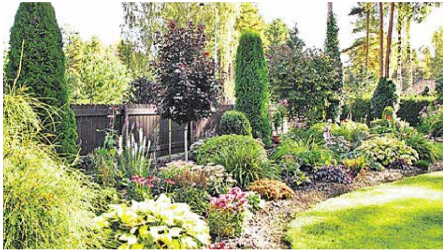
Esimene koht Laaniku 13 aed.