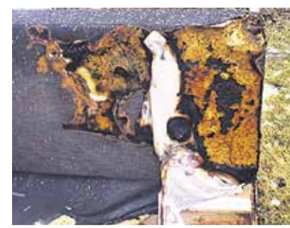
Mobiiltelefoni ja sülearvuti laadimisest süttinud diivan.

■ Elektrikerisel või elektriradiaatoril ei ole mõistlik kuivatada riideid, te-